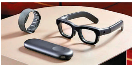
▲Orion的外觀及佩戴感和普通眼鏡一樣，且可以配有透明鏡片。