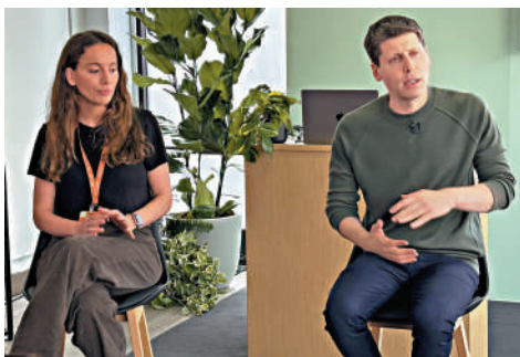
▲OpenAI公司CEO阿爾特曼（右）和技術總監穆拉提（左）。

「想要創造時間和空間來做自己的探索」。阿爾特曼對穆拉提為OpenAI的創立和所實現的目標表示感謝，「我最感激的是她在困難時期給予我的支持和關愛」。