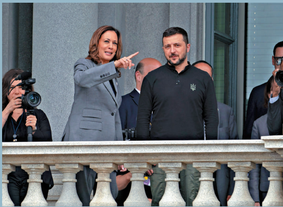
▲哈里斯（左）與澤連斯基（右）26日在白宮會面。

持續兩年多的俄烏衝突，再次成為美國大選選戰的焦點。烏克蘭總統澤連斯基9月22日到訪美國出席聯合國大會，順便兜售其「勝利計劃」。澤連斯基先後會晤總統拜登、副總統兼民主黨候選人哈里斯。前一天表示拒絕與澤連斯基會晤的共和黨候選人特朗普突然改變態度，宣布27日與澤連斯基會晤。隨着美國大選投票日臨近，澤連斯基的訪美行程被批「干預」大選。