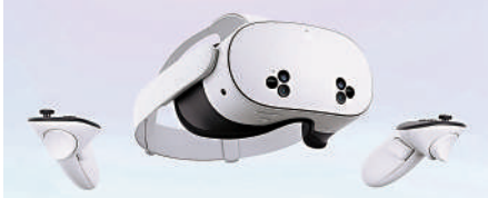
▲Meta全新MR頭戴式裝置Quest 3S。網絡圖片

【大公報訊】綜合報道：Facebook母公司Meta26日在Meta Connect 2024大會上推出一系列硬件新產品，當中包括引入AI功能的全新擴增實境（AR）眼鏡Orion，混合實境（MR）的可穿戴裝置Quest 3S，以及擁有AI功能的Ray-Ban Meta智慧眼鏡的升級版。