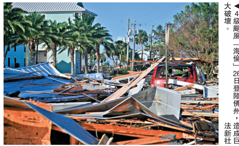
▲4級颶風「海倫」26日登陸佛州，造成巨破壞。

外媒披露，OpenAI今年頻傳人事變動，多名元老出走。除穆拉提外，共同創辦人舒曼已加入競爭對手Anthropic的陣營，另一名共同創辦人布羅克曼正在放長假中。目前尚不確定高層人事地震是否與公司轉型有關。