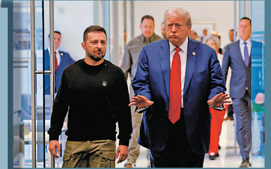
▲特朗普（右）與澤連斯基（左）27日在紐約特朗普大廈會面。