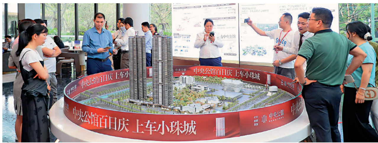
◀30日，廣州有樓盤推出「買房送車」優惠，吸引大量看房客前來諮詢。

成都高新區 支持購房就學；購買新房補貼2萬至6萬元消費券；促進以舊換新；無住房或有一套房但正掛牌出售的，均認定為首套住房