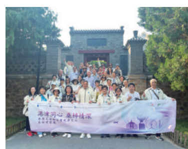
▲參訪團成員合影留念。

參訪團成員紛紛表示，離鄉赴港多年，思鄉之情迫切，此次活動話鄉情誼，品家鄉美味，親身感受家鄉發展變化，倍感親切、溫暖