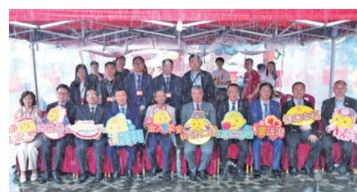
▲賓主一同出席「《銅人同健康》中醫藥文化嘉年華」開幕禮。

是中華文化對家庭延續、對天人和諧的追求，這也是中醫藥追求天人合一的宗旨，兩者息息相關。同仁堂亦希望藉著「百子櫃」，向大眾傳遞日常生活健康養生，延年益壽的祝福。此外，北京同仁堂還於今年9月至10月，為市民準備了健康講座、展覽和遊戲等一系列健康主題活動，教導大眾預防或者控制三高，注意預防都市疾病以及預防中風，關注心腦血管健康等。