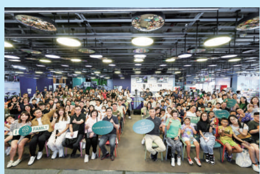
▲華懋集團逾350名同事及其家人出席「CCG家庭日」年度團隊活動。

據了解，「華懋集團獎學金」計劃自2021開始推行，予同事就讀本地大專院校、中學及小學的子女申請，以表彰其學術上的卓越表現。計劃旨在提升團隊歸屬感，將企業關懷文化延伸至團隊家人。是屆獎學金得獎人數較去年大幅增加三成四。