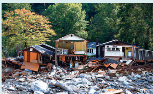
▲颶風「海倫妮」過境摧毀房屋。