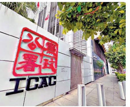
▲廉署起訴百佳前主管等四人，指他們涉虛構值勤紀錄騙取三百二十萬元。

廉署早前接獲貪污投訴遂展開調查，發現有被告涉嫌租用配送中心附近一間辦公室，並購買一部與配送中心同型號的打卡機，在辦公室偽造13名「鬼工」的值勤紀錄，再將虛假紀錄帶回配送中心，騙取工資後平均攤分得益。涉案13名工人於案發期間從未於配送中心工作，亦沒有收取任何工資，值勤紀錄上有關他們的簽署是假冒的，他們亦未曾在收訖工資確認書上簽署。