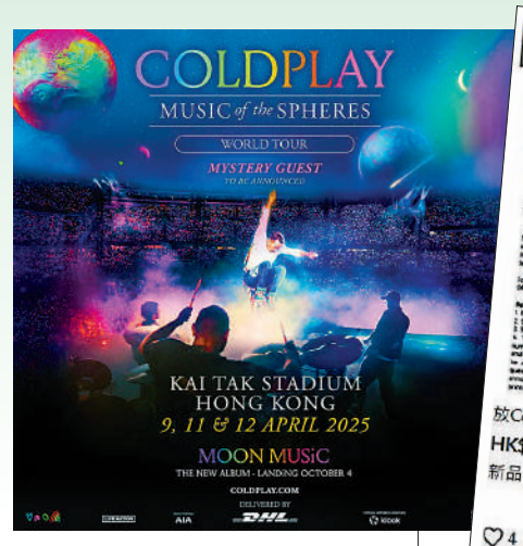
▲英國搖滾樂隊Coldplay啟德體育園演唱會門票，被黃牛黨炒貴近一倍。

網上購物平台隨即出現「黃牛黨」，有人以4000元，出售原價2099元的門票，較原價貴九成，又要求買家先交訂金；另外有聲稱放售3張原價1399元的企位門票，每張索價2300元，較原價高出64%；亦有人索價1.2萬元，放售4張原價1299元的連位門票。