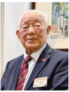
▲香港珠海學院校董會主席、兩岸和平發展聯合總會首席會長林廣兆積極推動兩岸文化交流。