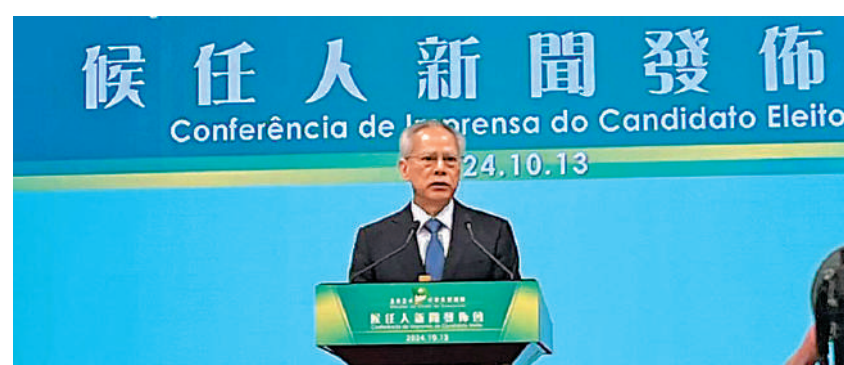
▲澳門特區終審法院昨日正式宣布，岑浩輝為下一任澳門特別行政區行政長官候任人。

頒獎禮昨日舉行，公務員事務局局長楊何蓓茵頒發獎項予各得獎者，他們所屬部門的首長或代表亦到場祝賀，分享喜悅。楊何蓓茵在頒獎禮上表示，參賽作