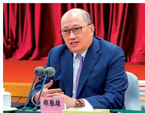
▲中央政府駐港聯絡辦主任鄭雁雄出席座談會並講話。 ▲中央政府駐港聯絡辦舉行港區全國人大代表和全國政協委員座談會，學習貫徹習近平總書記重要講話精神。

鄭雁雄強調，習近平總書記的重要講話立意高遠、思想深邃、催人奮進，進一步豐富和發展了習近平總書記關於堅持和完善人民代表大會制度的重要思想、關於加強和改進人民政治協商工作的重要思想，把我們對國家根本政治制度和重要基本政治制度的規律性認識提升到嶄新高度，具有十分重要的理論意義、實踐意義、歷史意義。學習貫徹好習近平總書記重要講話精神，是中央政府駐港聯絡辦和港區全國人大代表、全國政協委員的共同政治責任。要以習近平總書記重要講話精神為引領，把準方向、踩實步伐，在新的歷史起點上更好發揮港區代表委員「雙重積極作用」，以實際行動進一步書寫人大政協制度優勢的香港篇章。