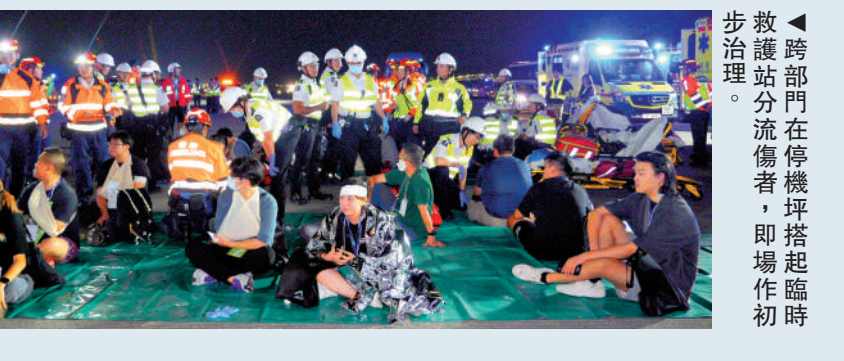
▲跨部門在停機坪搭起臨時救護站分流傷者，即場作初步治理。

消防員模擬從客機救出受傷的旅客及機組人員，停機坪上搭起臨時救護站進行分流，傷者即場接受初步治理後，分批送往四間公立醫院。無受傷的旅客則被送往機場的旅客接待中心，安排辦理入境手續等程序。