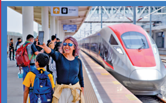
▲10月17日，在印度尼西亞帕達拉朗站，乘客在雅萬高鐵高速動車組前自拍。新華社