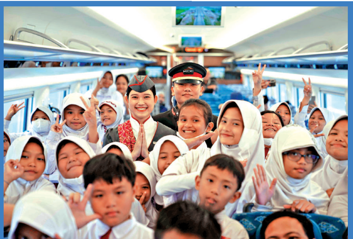
▲雅萬高鐵的小乘客與高鐵路務組成員合影留念。