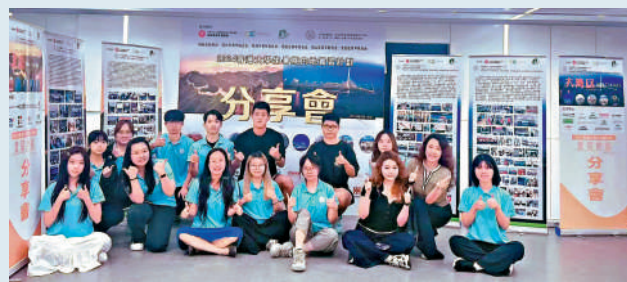
▲2024香港青年實習資助計劃粵港澳大灣區實習於8月時圓滿收官。

本屆政府十分重視青年發展，民青局於2022年年底公布《青年發展藍圖》，當中提出進一步加強內地及海外的實習和交流計劃的廣度和深度，推動香港青年認識國家，支持青年融入國家發展大局。民青局和青發會透過「青年內地實習資助計劃」資助非政府機構舉辦青年到內地實習的項目，讓他們親身體驗內地職場實況，加深對內地就業市場、職場文化及發展機會的了解，從而協助青年人訂立未來工作方向，並藉此累積工作經驗，建立人脈網絡，增強他們將來的就業優勢。