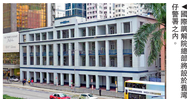
▲國際調解院總部將設於舊灣仔警署之內。

國際調解院將是世界上首個專門以調解方式解決國際爭端的政府間國際法律組織，旨在實現爭端各方的合作共贏，是落實《聯合國憲章》規定的以調解方式和平解決國際爭端的重要機制，為和平解決國際爭端提供新的選擇。