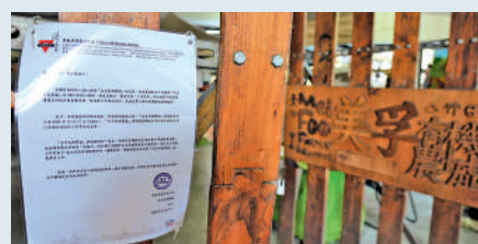
▲主辦機關在農墟外貼出告示，農墟將於10月27日最後營業。