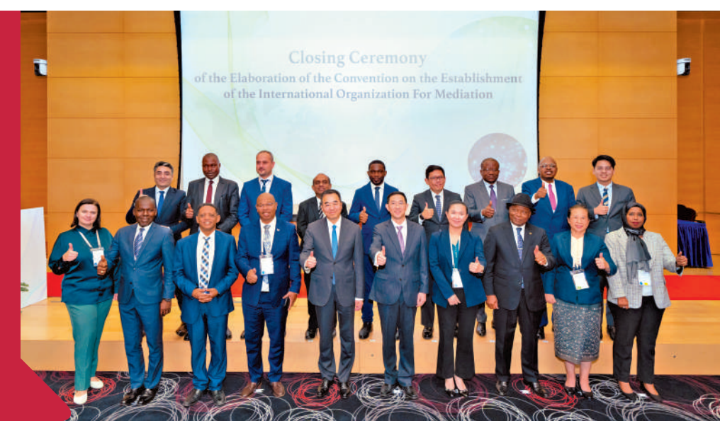
在《關於建立國際調解院的公約》第五屆談判會議在中國香港特區舉行。