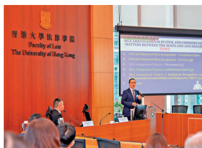
▲律政司司長林定國出席有關香港和內地相互法律協助的講座，指CEPA第二份貿易協議增加了內地和香港的跨境仲裁機會。