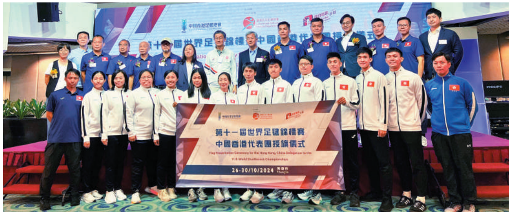
▲中國香港足毬總會於昨午在沙田舉行授旗儀式。