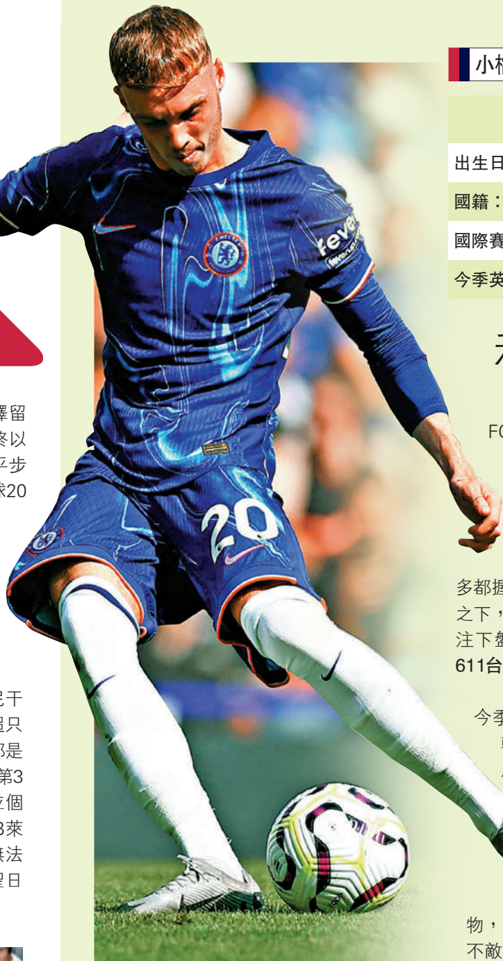
▲車路士中場高爾彭馬。