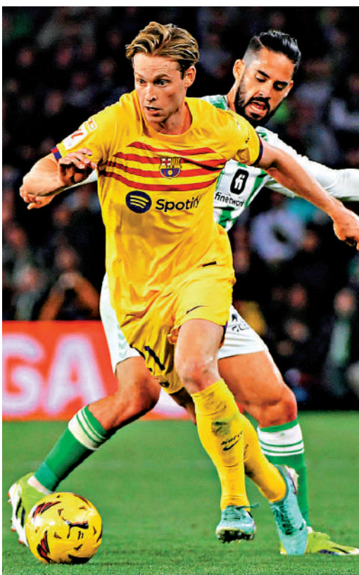
▲曼聯有意重提收購迪莊(前)。