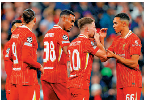
▲利物浦在首七輪英超後位居榜首。

同一時間，貴為法國國腳的尼千古就慘成「二隊大佬」，他在英超只有一仗上陣多於45分鐘，其餘6仗都是「楔時間」的替補，倒是在聯賽盃第3圈對「乙組仔」巴羅成為主力，並個人射入3球，但對近5000萬鎊由RB萊比錫來投的他自然不足夠，假如無法成為英超主力，他會在今夏回巢聖日耳門。