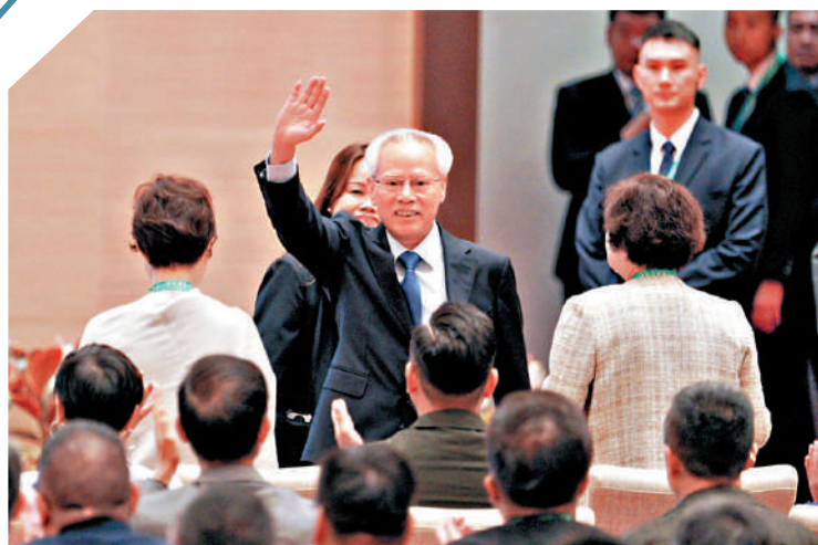
▲《澳門特別行政區公報》昨日刊登公告，宣布行政長官選舉當選的候選人為岑浩輝。

21日至27日，外國駐港領團和商界山東參訪團將先後赴濟南、濰州、泰安、威海、煙台、青島等地參觀訪問，考察當地重點產業園區和代表性企業，並與當地政府負責人進行交流。