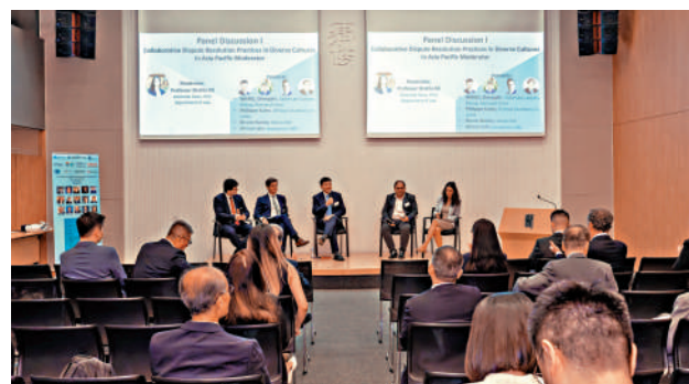
▲「法律、和平與和諧發展研討會」昨日在律政中心舉行。