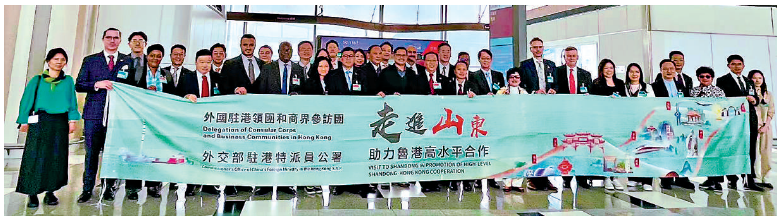
▲外交部駐港公署在香港國際機場舉行外國駐港領團和商界赴山東參訪活動啟動儀式。

10月21日晚間，山東省委書記林武在山東大廈會見了外交部駐港公署特派員崔建春率領的外國駐港領團和商界參訪團一行。外交部駐港公署此次共組織近20個國家和地區的駐港領團、商會、跨國企業、金融機構及媒體代表，參訪團成員60餘人。