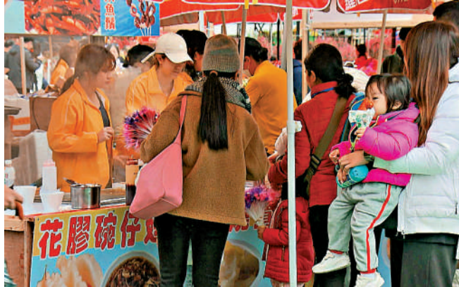
維園年宵攤位備受矚目，最接近銅鑼灣出入口的兩個快餐攤位，最終分別以18萬及18.2萬元成交。圖為去年維園其中一個快餐攤位。

明年維多利亞公園年宵市場的395個年宵攤位，昨日起一連三日公開競投，吸引不少市民到場。