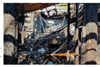
前晚近7時，元朗舊墟長盛街26C號大王古廟起火，一度傳出爆炸聲。大火過後，大王古廟損毀嚴重。

【大公報訊】記者古倬勳報道：位於元朗舊墟，擁有三百多年歷史的一級歷史建築大王古廟前晚（21日）發生火警，消防用了約一小時將火救熄。在火警之後，昨（22日）早仍有多名消防員向廟內射水降溫以防死灰復燃，其後數名古蹟辦及屋宇署人員到場了解。廟外仍被警方拉上封鎖線，初步懷疑火警是因為雪櫃短路所致。