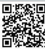
掃一掃有片睇