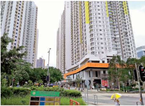
一名公屋女住戶因在申請公屋時，被判定瞞報有香港住宅物業，被判監禁三十天，而涉案物業單位亦已被收回。

【大公報訊】沙田碩門邨有住戶因在申請公屋時沒有申報擁有元朗的住宅物業，被控虛假陳述罪，早前在沙田法院被裁定罪名成立，至前日（21日）判刑監禁30天，涉案公屋單位已於今年5月被收回。據悉，此個案為第二宗涉及瞞報判監而不獲緩刑個案。