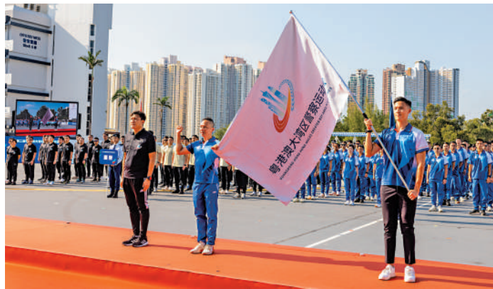
「第二屆粵港澳大灣區警察運動會」由昨日（22日）至二十五日在香港舉行。

香港警務處組織逾千人員和義工參與今屆運動會；廣東省和澳門則分別組織約140人及130人的代表團赴港參加運動會。