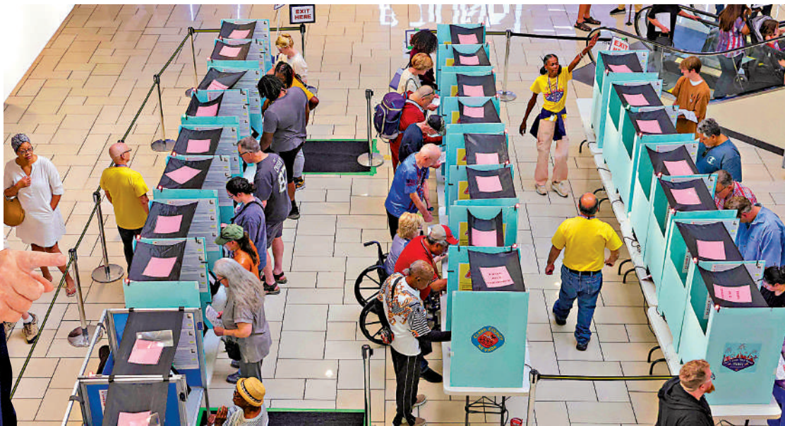
內華達州選民在拉斯維加斯新票站提前投票。