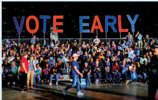
▲民主黨選民22日在底特律參加造勢大會。

特朗普競選團隊發表聲明，稱拜登和哈里斯的計劃是「政治迫害」特朗普，「因為他們無法公平公正地擊敗他」。美媒指出，特朗普2016年競選總統時曾多次對支持者高呼，「把她關起來」，他指的是當時的民主黨總統候選人希拉里。（綜合報道）