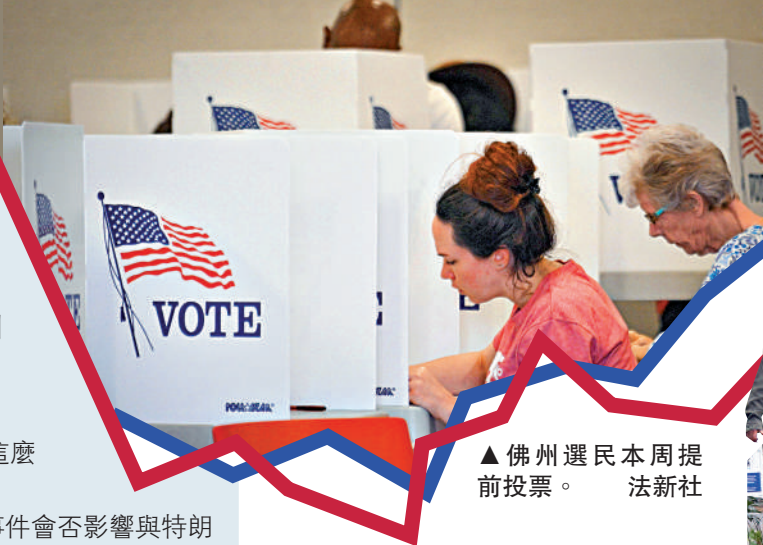
▲佛州選民本周提前投票。