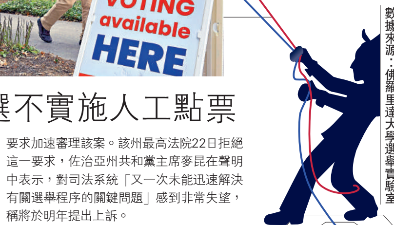
數據來源：佛羅里達大學選舉實驗室