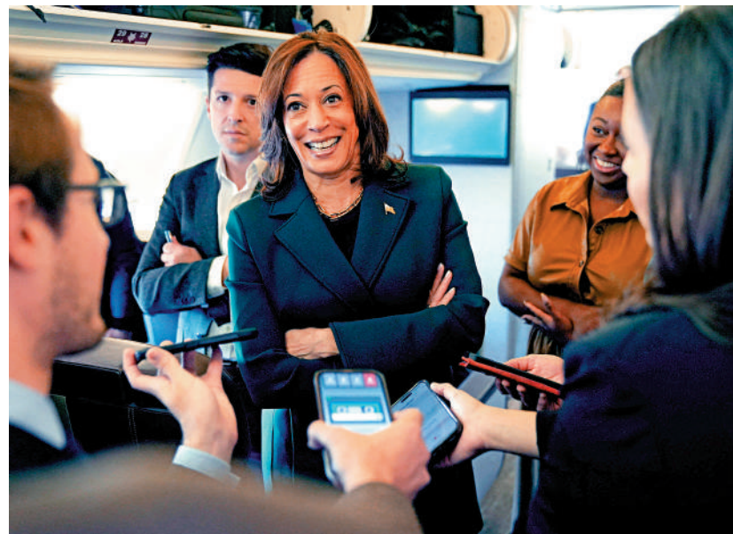
美國民主黨總統候選人哈里斯。