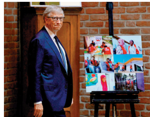
▲美國微軟公司創辦人比爾·蓋茨。

加密貨幣預測市場平台Polymarket顯示，賬戶Fred9999與其他3個賬戶重金押注特朗普，總計投注超過4300萬美元。該平台上特朗普最新勝選幾率達到64.0%，哈里斯只有35.9%。Polymarket已經累積了近23億美元的大選賭注。