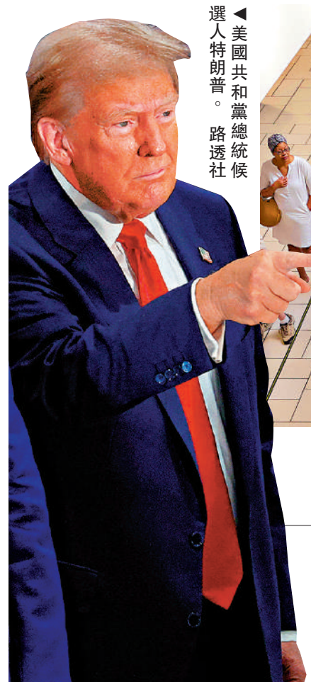
美國共和黨總統候選人特朗普。