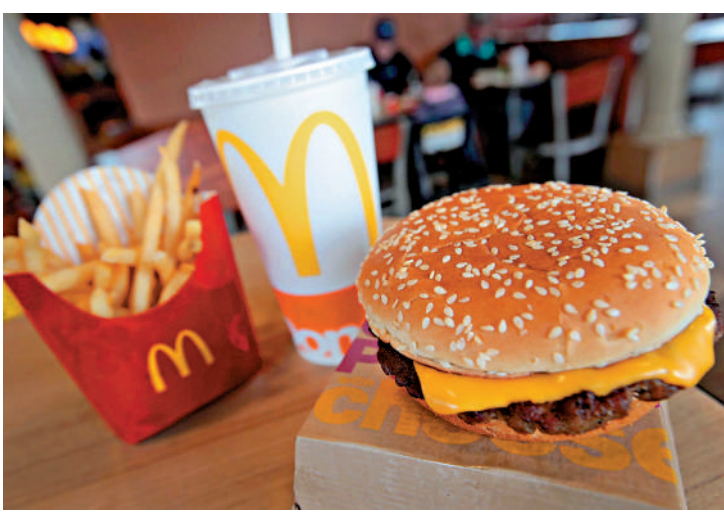
引發大規模食物中毒。▲美國麥當勞「足三兩」漢堡涉因大腸桿菌

香港麥當勞公司發言人23日表示，有關受影響之產品及食材只用於美國當地部分地區的餐廳，完全不涉及香港麥當勞的產品及食材，因此本港顧客可繼續安心食用。