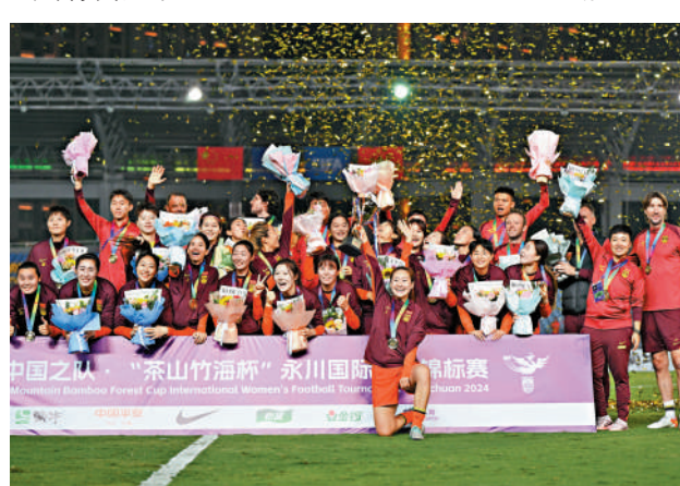
▲中國女足在頒獎儀式上。

本屆永川國際女足錦標賽戰罷，中國女足兩戰全勝，進5球、零失球奪冠；越南女足1勝1負獲得亞軍，烏茲別克斯坦女足兩戰皆敗獲得季軍。