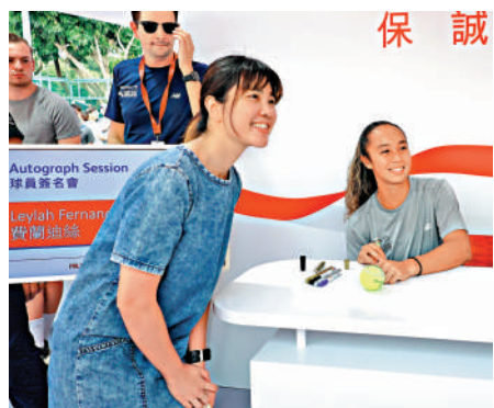
▲費蘭迪絲（右）與球迷合照。

主辦方亦於「網球同樂區」邀請了世界排名第32位的加拿大球手費蘭迪絲前往簽名區與球迷互動，後者於周二的32強賽中成功晉級並在昨天迎來休息日。為了拿到球星的簽名，不少球迷無懼炎熱的天氣，提前一個小時開始排隊等候。簽名會上，部分「追星族」攜帶印有費蘭迪絲Logo的球拍、球衣等物品給偶像簽名，並與偶像拍照留念。