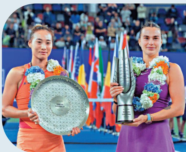
▲鄭欽文（左）在武漢網球賽不敵莎芭蓮卡，屈居亞軍。