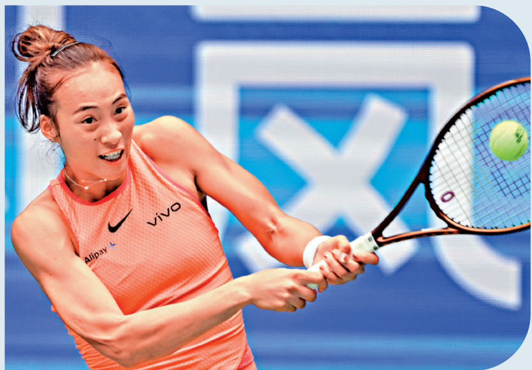
▲鄭欽文本季發揮出色，成功取得年終總決賽入場券。