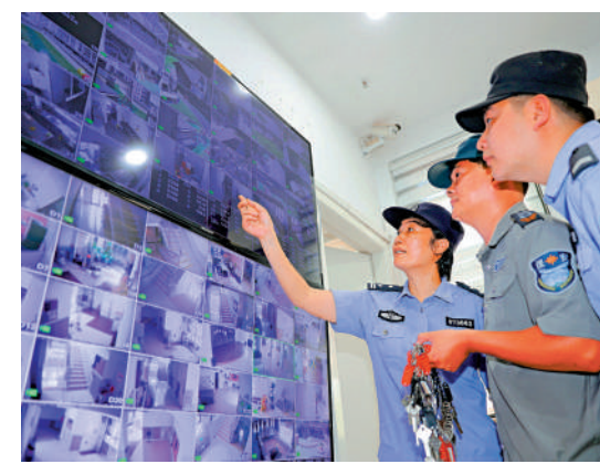
▲浙江省台州市路橋區桐嶼街道派出所民警開展校園安全檢查工作。

為確保安全，《設置標準》指出，面向中小學生的民辦教育培訓機構，應當符合校外培訓機構消防安全管理九項規定，建立健全防護措施和檢查制度，實現視頻監控全覆蓋，並配備數據存儲。開展職業技能培訓的機構，應當建立器械操作和安全管理工作制度，制定應急預案等。