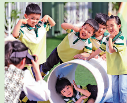
▲杭州市錦繡幼兒園的小朋友參加遊園活動時合影留念。