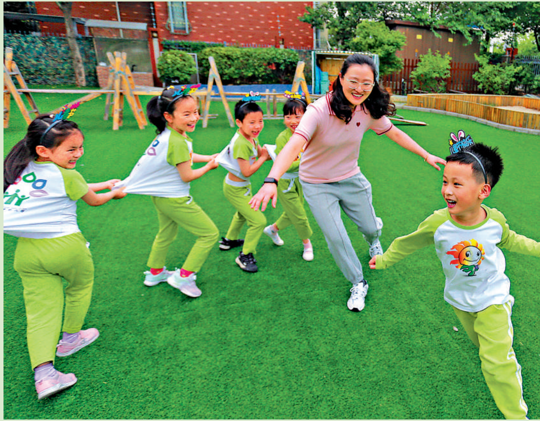
▲學前教育是國民教育體系的重要組成部分，是重要的社會公益事業。圖為在揚州大學附屬西郡幼兒園，小朋友和老師玩「老鷹捉小雞」遊戲。

在內地的公立幼兒園中，就讀幼兒園要年滿三周歲。三周歲以下的幼兒多由家長自行照料。隨着學前教育法的出台，託育服務立法也備受關注。記者注意到，學前教育法在附則中規定，鼓勵有條件的幼兒園開設託班，提供託育服務。幼兒園提供託育服務的，依照有關法律法規和國家有關規定執行。對此，不少家長表示，期待國家立法開辦三歲以下幼兒託育班，配備良好的師資和硬件設施，此類需求非常迫切。