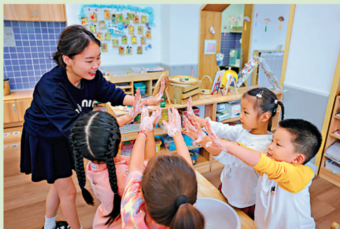
▲浙江省諸暨市越都幼兒園的老師在指導小朋友正確洗手。

此外，嚴格聘用管理，規定幼兒園聘任教師等工作人員應當報教育行政部門備案並進行背景查詢和健康檢查；存在可能危害兒童身心安全、不宜從事學前教育工作情形的，不得聘任。規定幼兒園及其舉辦者應當保障教職工的工資福利，要求將公辦幼兒園教師工資納入財政保障範圍。加強培養培訓，規定政府及有關部門應當制定學前教師資質培養培訓規劃，開展各種形式的培訓。