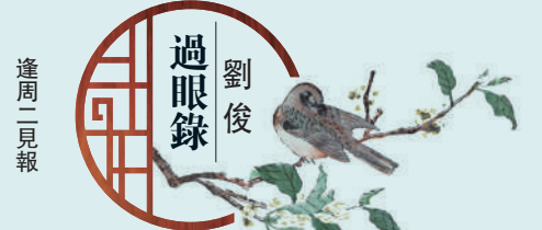
過眼錄 劉俊 逢周一見報

曹家與皇室複雜的主奴糾葛引發的政治風波，說起來竟然成了《紅樓夢》得以產生的一個原因。