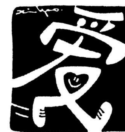
愛——是一個動詞。漫條思理 鄭辛遙 逢周二、四見報

我身邊的朋友和我一樣，大概都是已過中年，即使未至花甲，亦不遠矣。在這時候，身體其實都有不同的狀況，有些朋友平時熱愛運動，又或注重健康生活，但身體亦會陸續出現