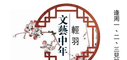
文藝中年 輕羽 逢周一、二、三見報