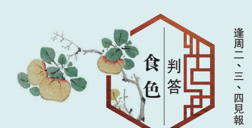
食色判答 逢周二、三、四見報

日劇《孤獨的美食家》裏，五郎那句獨自已成名言：「不被時間社會束縛，幸福地填飽肚子時候，瞬間隨心所欲；這種不被任何人打擾享受美食的孤高行為，是每個現代人都平等擁有的最好治療。」雖然經典，但每每想起依舊感懷，彷彿呆在生活的臂彎裏換個姿勢，又找到了新的溫暖安慰。