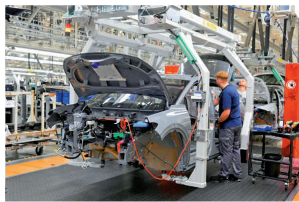
▲特朗普向德國車企施壓，要求其將生產線搬到美國。

寶馬董事長齊普策強調，寶馬在美國南卡羅來納州有一家工廠，可以在一定程度上免受潛在關稅的影響。大眾汽車、梅賽德斯-奔馳分別在田納西州和亞拉巴馬州設有工廠。空中巴士、西門子、巴斯夫、雀巢和聯合利華等歐洲企業同樣在美國國內為美國市場提供服務。然而，滿足特朗普的所有要求並非易事。空巴A330和A350寬體飛機在法國組裝，大眾汽車最暢銷的車型在墨西哥製造。大多數歐盟企業仍選擇在歐洲本土生產高性能車型，再出口至美國。