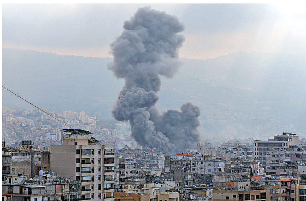
▲以軍13日轟炸貝魯特南郊。