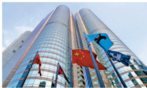
▲內地投資者通過港股通持有的資產市值已超過3.3萬億元。

第二，繼續推動「互聯互通」深化擴容，讓香港在國家金融市場的開放和發展過程中，更好發揮「防火牆」、「試驗田」和資金引領平台的作用。他指，會在「互聯互通」的基礎上，進一步豐富產品類別、擴大標的範圍，在風險可控下不斷推動各種政策和產品創新，貢獻國家發展。