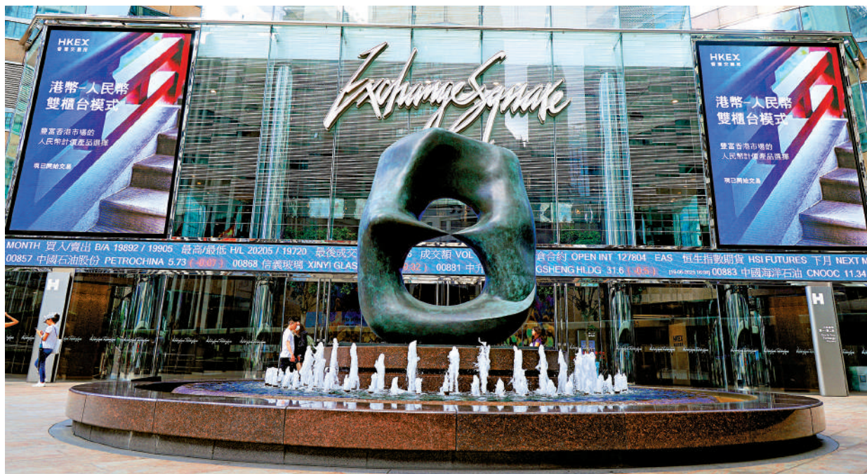
內地與香港正就人民幣櫃台納入互聯互通開展工作。