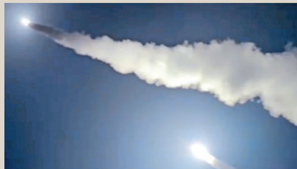
▲社媒流傳的畫面顯示，烏軍19日發射美製ATACMS導彈。

美國候任總統特朗普主張削減對烏援助，拜登政府則在「最後時刻」不斷加碼對烏軍援。美媒指出，拜登的舉動對戰況實際影響有限，但可以給特朗普「埋雷」，讓他接管白宮後不得不面對一場風險更高的戰爭。（綜合報道）