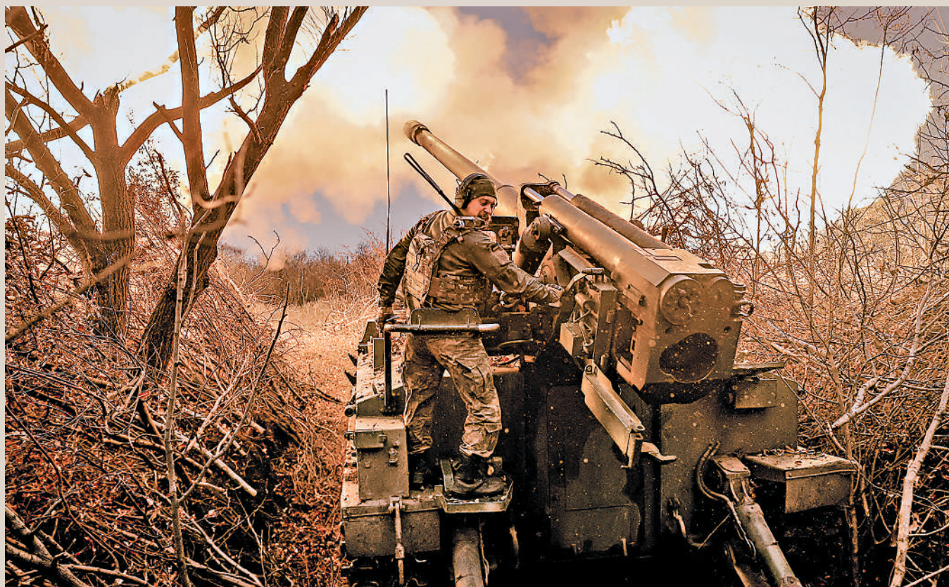
▲烏軍18日在頓涅茨克地區向俄軍陣地開火。

因擔心北約直接捲入衝突，朔爾茨一直反對向烏克蘭提供德國的「金牛座」巡航導彈。這種導彈射程可達500公里，超過美國的陸軍戰術導彈系統（ATACMS）和英法聯合開發的「風暴陰影」導彈（法國稱「斯卡普」導彈）。德國政府發言人18日重申，朔爾茨不希望交付遠程導彈的立場並未改變。