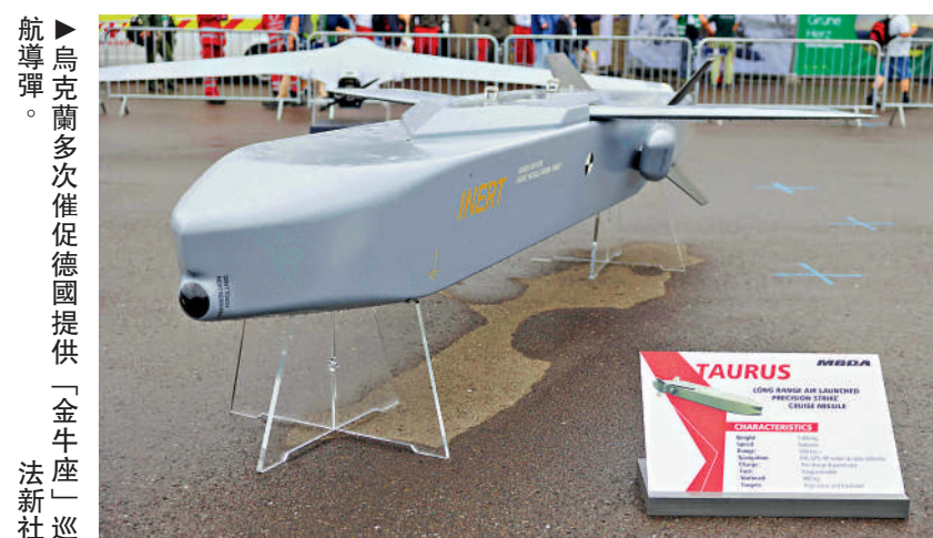
▲烏克蘭多次催促德國提供「金牛座」巡航導彈。