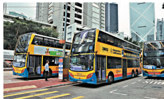
▲立法會昨日討論巴士加價申請，多名議員表示不支持，促請政府把關。

加可減票價機制。九巴、城巴及嶼巴代表均表示支持建立恆常檢討票價的機制，惟指出同時要考虑燃油價格及薪酬開支等因素。