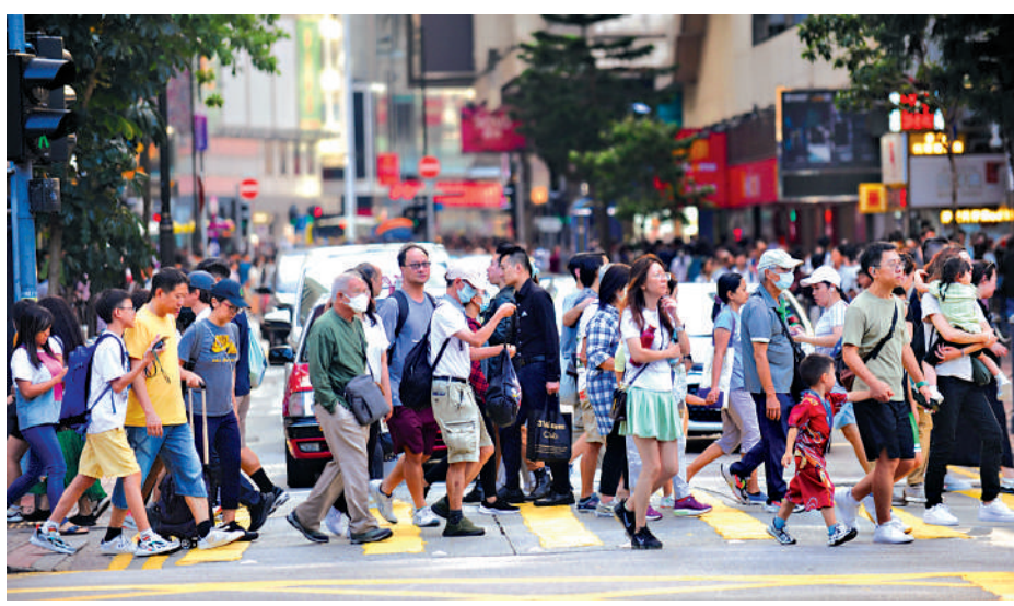
關係全港打工仔的取消強積金「對沖」安排將於明年五月一日實施。資料圖片

取消強積金對沖安排會在明年5月1日起生效，取消對沖後，僱主強積金強制性供款累算權益不可「對沖」僱員在「轉制日」起服務年資的遣散費或長期服務金。