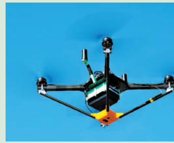
▲民航處有逾7000架無人機仍待核實，近兩成等候核實超過兩年。

審計署發現，截至今年6月30日，在SUA一站通數據庫核實中的小型無人機有6997架，當中有1257架，即18%被列入核實名單超過24個月。