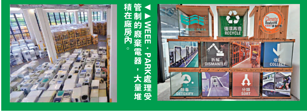
▲WEEE·PARK處理受管制的廢棄電器，大量堆積在廠房內。

為合理處理廢電器電子產品而避免污染土地和環境，政府早前推行廢電器電子產品生產者責任計劃，受管制電器包括空調機、額定總容積不多於900公升的電冰箱、額定洗衣量不多於15公斤的洗衣機、獨立式乾衣機、電腦、列印機等。2015年，立法會批准發展廢電器電子產品處理及回收設施WEEE·PARK，廠內設有四條處理線，預計每年可處理和循環再造3萬公噸受管制廢電器電子產品。