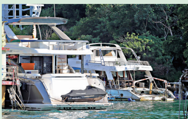
▲香港仔避風塘有多艘破爛舊船佔用了泊位。

創科署本月初曾公布，香港應用科技研究院和納米及先進材料研發院的合併計劃，預計於2025至26年度內開始啟動合併的過渡安排。