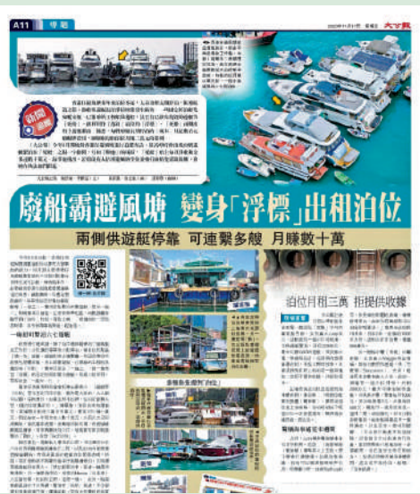
▲《大公報》去年11月曾刊出有關「死船」佔泊位的調查報道，引起廣泛關注。