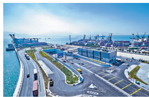
▲屯門至赤鱗角連接路因口岸填海工程而延誤，多花逾10億公帑。

審計署認為，路政署在配合工程的管理方面需改善，應加強項目管理規劃，並審慎核實招標文件及提升建築工地安全等。路政署署長、運輸署署長和機電工程署署長均同意審計署的建議。