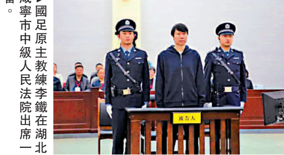
▲咸寧市中級法院原主教練李鐵出庭。

【大公報訊】記者張帥武漢報道：國足原主教練李鐵一審被五罪並罰，獲刑20年。昨日（12月23日）為上訴期限的最後一天，湖北省咸寧市中級人民法院已收到李鐵的上訴書。出生於1977年的李鐵曾是中國男足主力球員之一，並於2019年至2021年期間擔任過國家選拔隊主教練、國足主教練，其被審查起訴彰顯官方重拳整治足球腐敗的立場，深入推進足球反腐和行風整治。