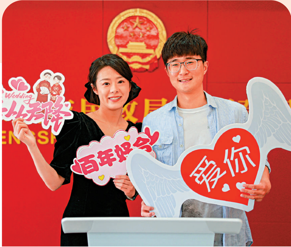
▲內地多地婚姻登記處宣布元旦期間正常辦公。圖為一對新人在山東省榮成市婚姻登記處合影留念。