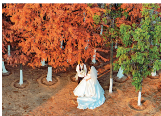
▲12月18日，一對新人在湖南松雅湖國家濕地公園拍攝婚紗照。

了儀式感、情感需求，甚至消費體驗。」在元旦假期的婚姻登記潮中，情感經濟的影子尤為顯著。隨着社會情感觀念的變化，人們對婚姻的態度也逐漸發生了變化：年輕一代越來越注重婚姻的「儀式感」和「契約感」，他們希望通過個性化、定製化的婚戀服務來體現自己對婚姻的重視。