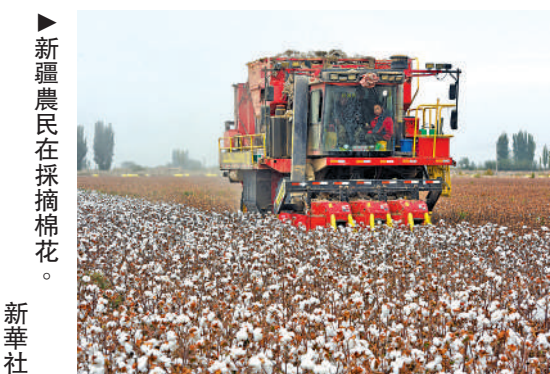
新疆農民在採摘棉花。

據了解，數據一般分為公共數據、企業數據、個人數據三個方面。此前關於加快公共數據資源開發利用的意見已經印發。此次發布的意見事關企業數據開發利用，進一步完善了中國不同類型數據資源開發利用的政策體系。