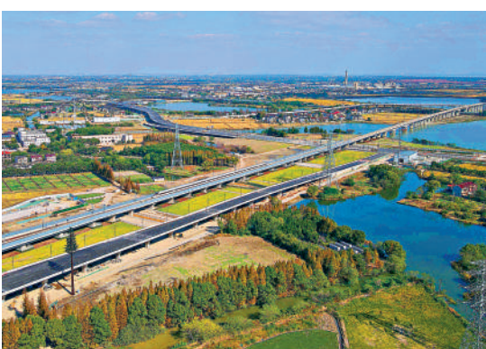
▲上月，滬蘇湖高鐵列車進行列車運行圖參數測試。

滬蘇湖高鐵在上海虹橋站連通上海鐵路樞紐，在湖州站與寧杭高鐵、合杭高鐵連接，是長三角高鐵聯網、補網、強鏈的重點項目。該項目建成運營後，將進一步完善區域路網布局，推動長三角地區基礎設施一體化建設。