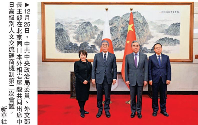
12月25日，中共中央政治局委員、外交部長王毅在北京同日本外相岩屋毅共同出席中日高級別人文交流磋商機制第二次會議。

【大公報訊】據新華社報道：李強表示，上個月，習近平主席同石破茂首相在秘魯舉行會晤，雙方一致同意共同努力全面推進中日戰略互惠關係，致力於構建契合新時代要求的建設性、穩定的中日關係。中方願同日方一道把握好這一正確方向，落實好兩國領導人達成的重要共識，推動雙邊關係持續健康發展，務實合作取得更多新成果。