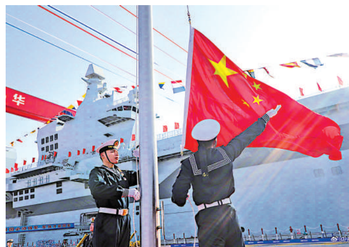
▲在27日的076兩棲攻擊艦首艦下水命名儀式上，五星紅旗冉冉升起。