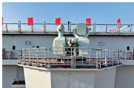
▲076型與國產航母裝備1130近防炮。 一樣

076型噸位大、航程遠，在世界上兩棲攻擊艦排序中名列前茅，也因此外界給予其「小航母」之稱。