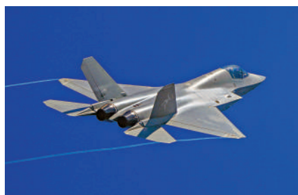
▲殲-35是076型潛在載機。 ▲076型可搭載兩棲裝備，或包括兩棲戰車。

該型艦是全球首次採用電磁彈射技術的兩棲攻擊艦，可以起飛直升機、艦載戰鬥機等各型戰鬥機以及固定翼無人機。