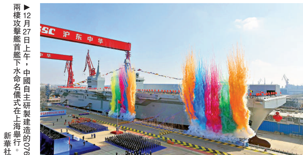
兩棲攻擊艦首艦下水命名儀式在上海舉行。

全球第一艘採用電磁彈射技術的兩棲攻擊艦四川艦，27日在上海正式下水。四川艦為076兩棲攻擊艦（兩攻）首艦，排水量4萬餘噸，是除了三航母之外，解放軍最大的作戰艦艇，也是第一艘雙艦島布局、燃氣動力的戰艦。憑藉創新的電磁彈射系統，四川艦能夠搭載多型固定翼戰機和直升機，同時可以搭載氣墊船、坦克，從而成為艦載武器裝備種類最多的新型戰艦，構建海陸空一體的立體化作戰體系。