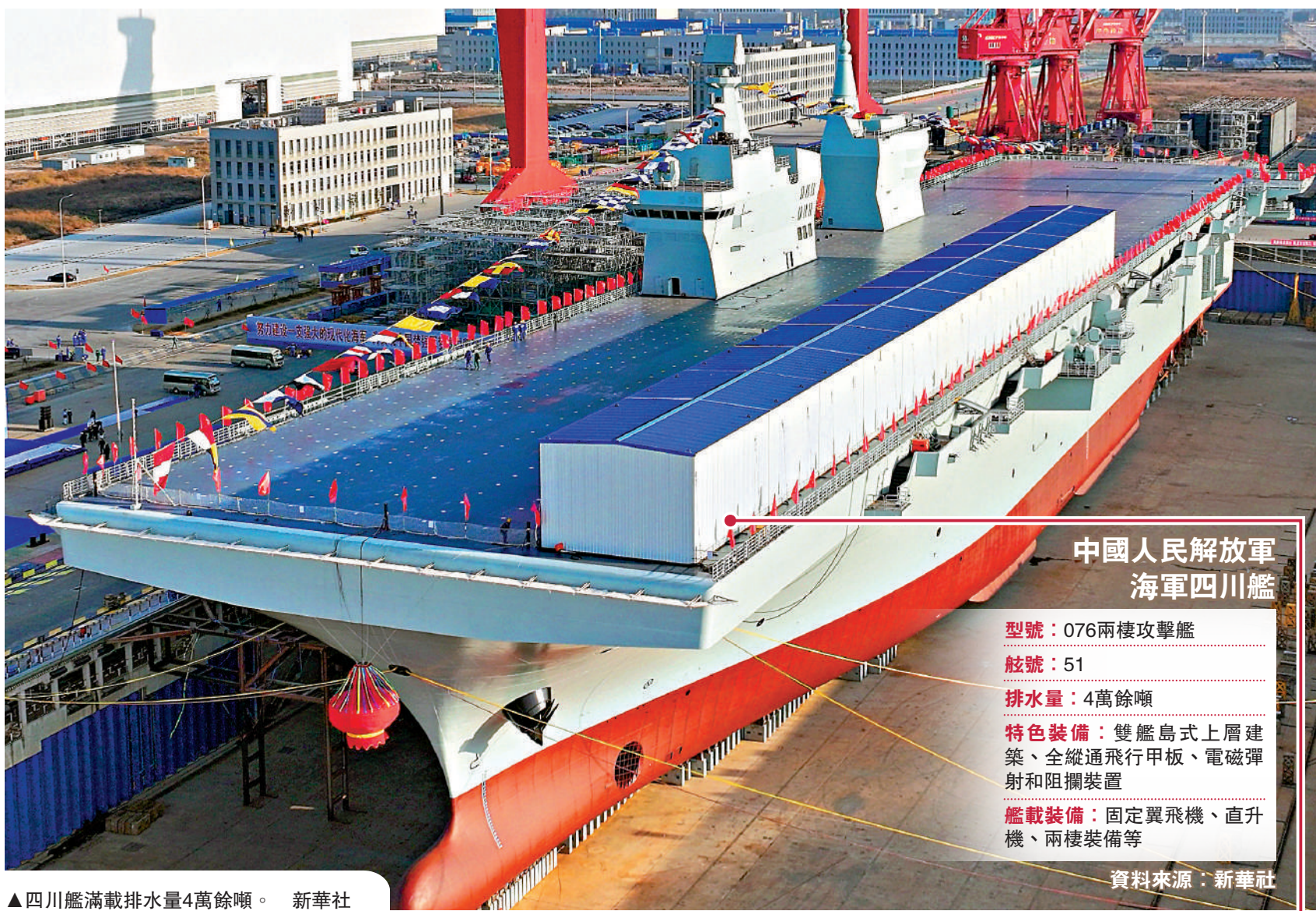
四川艦滿載排水量4萬餘噸。