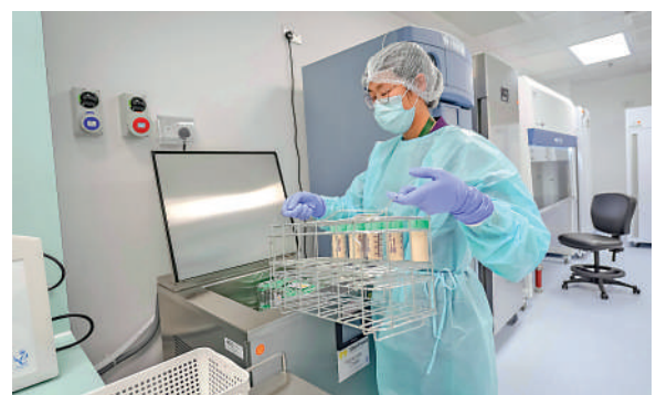
安嚴毒處◀格。微，乳度生當運控制物中包母庫確營養巴士會保品分德嚴質析德嚴和及消格

有意為捐贈者的母親可登入香港母乳庫官方網頁提交表格，或致電香港母乳庫3513 6688。談、填寫評估問卷，以及接受驗血篩查。合資格的捐贈者簽署同意書後，醫護人員將提供捐贈詳情及支援，之後母乳庫會安排物流承辦商上門收集母乳。香港母乳庫總監黃明沁表示，母乳是嬰兒最理想的食物，能提供最完善的營養和健康發展所需，呼籲正在授乳的合資格母親，慷慨捐出母乳給這些有需要的初生嬰兒。