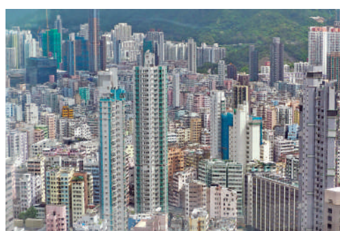
發展局昨日就修訂《建築物條例》的建議展開公眾諮詢，為期兩個月。

站。發展局表示，早前在12月中向立法會發展事務委員會簡介有關建議，委員普遍贊同檢討方向。發展局會在兩個月諮詢期內，為相關持份者安排簡介會，聽取意見，亦歡迎市民或團體於今年2月28日或之前，以電郵、郵遞或網上表格的方式，就修訂《條例》的建議提出意見。