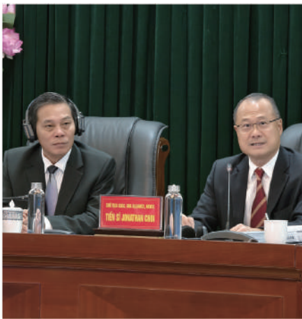
■ 海防市市長阮文松（左）向團員介紹該市最新發展。