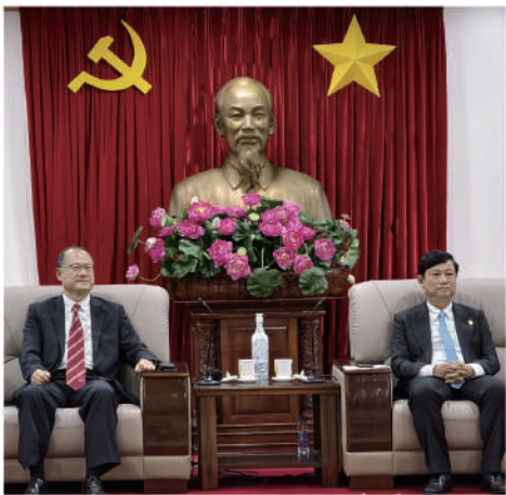
■ 平陽省人民委員會主席武文明（右）期望更多港企投資越南。