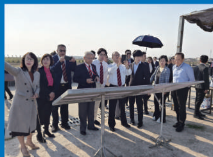
■ 團員參觀瀝縣非關稅區。