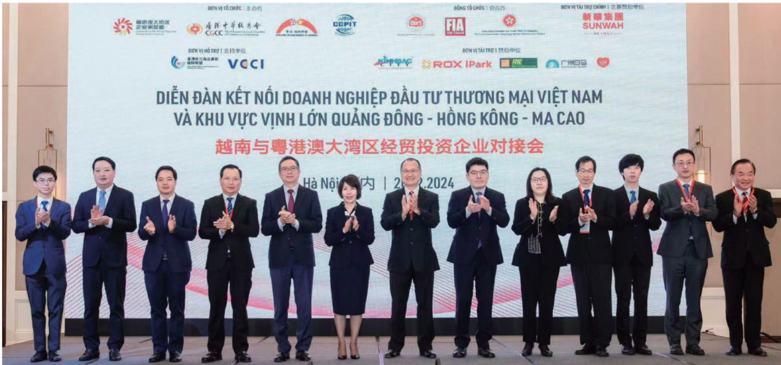
■ 越南與粵港澳大灣區經貿投資企業對接會深化港越經貿合作。

此外，考察團亦拜會海防市市長阮文松，並參觀海防南亭武工業園區、春橋瀝縣非關稅區及海防國際集裝箱港HICT，具體了解當地工業園建設、規劃及優惠政策等。