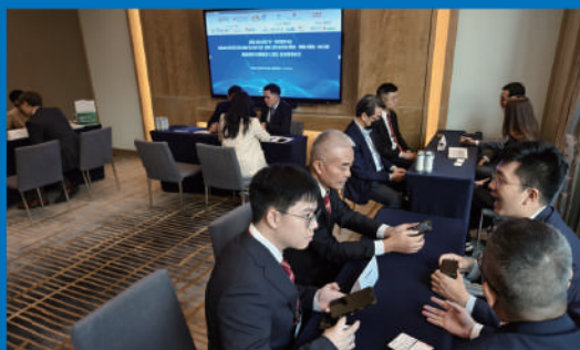
■ 團員透過多場商貿交流配對活動，探索與越南企業合作機遇。

蔡冠深亦表示，香港的專業服務優勢可作為強化越南與香港、深圳、廣州等灣區城市溝通合作的重要橋樑，並推動與越南工商企業在區域金融、智慧城市、新能源、環保及地鐵交通等領域深化交流合作。