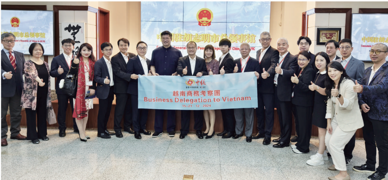
■ 團員與中國駐胡志明市總領事魏華祥（左八）合照。

香港中華總商會（中總）於2024年12月15至21日組織商貿代表團往越南考察，實地了解當地市場環境、投資政策和產業發展最新情況，又向當地企業推介香港金融、創科和專業服務優勢，並向越南企業推廣大灣區發展機遇，與大灣區和東盟企業攜手探索合作商機。