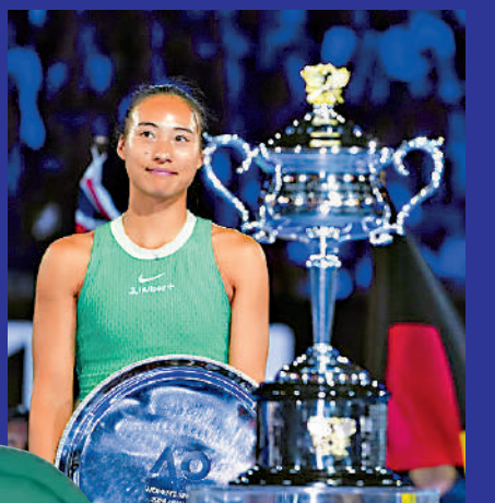
▲鄭欽文上屆首闖澳網決賽，最終不敵莎芭蓮卡獲得亞軍。