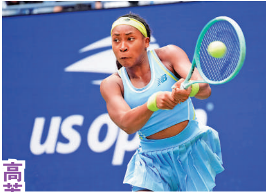
高芙 強項：頑強意志

鄭欽文應對方法：鄭欽文須加快整體回球的節奏，通過快節奏的回球打亂莎芭蓮卡的擊球節奏。