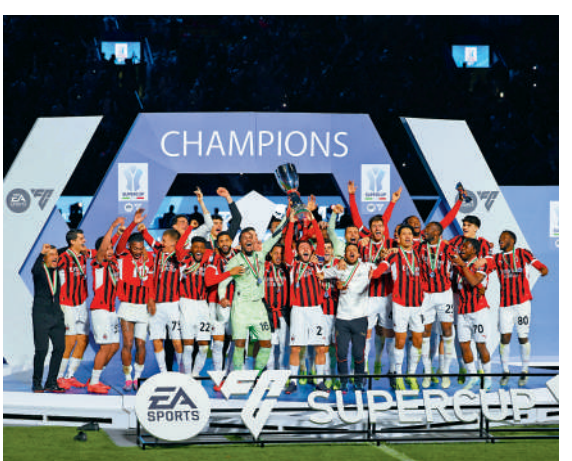
▲AC米蘭贏得意大利超級盃。

另外，有傳AC米蘭欲借用曼聯鋒將拉舒福特，讓後者有機會與英格蘭同胞奧巴謙和羅夫斯卓克當隊友。