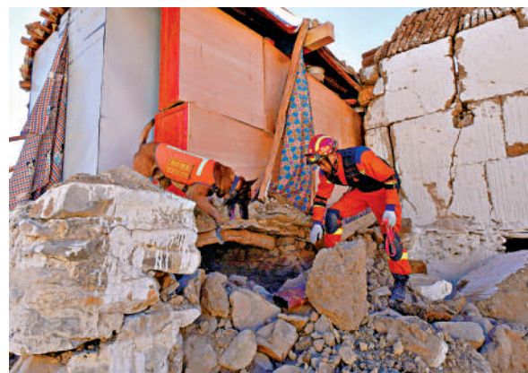
1月8日，西藏自治區消防救災總隊拉薩重型地震救援隊消防指戰員攜搜救犬進行搜救排查。