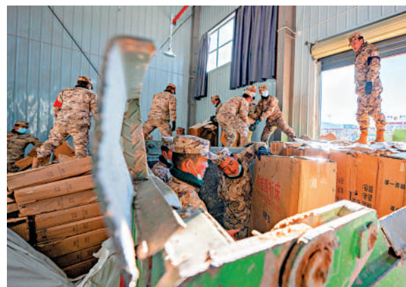
1月8日，在日喀則市經開區物資儲備倉庫，武警官兵在搬運抗震救災物資。