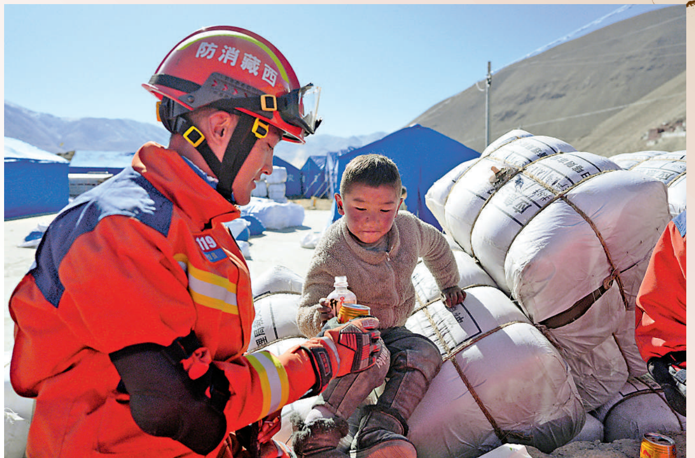
1月8日，在西藏日喀則市定日縣措果鄉塘仁村安置點，消防救災人員和小朋友互動。

同日，國務院台辦發言人陳斌華就台灣各界和民眾關心慰問西藏日喀則市定日縣災區表示感謝。他說，台灣各界和民眾通過多種形式向災區表達關心慰