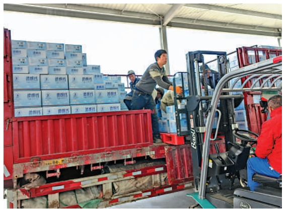
地震發生後，救援物資在日喀則裝運後分批次發往地震災區。