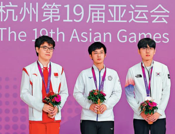
▲柯潔（左一）奪得杭州亞運男子個人賽亞軍。