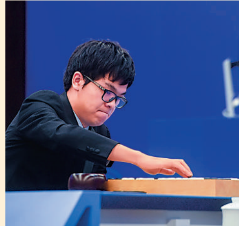
▲柯潔在2017年對陣人工智能AlphaGo。