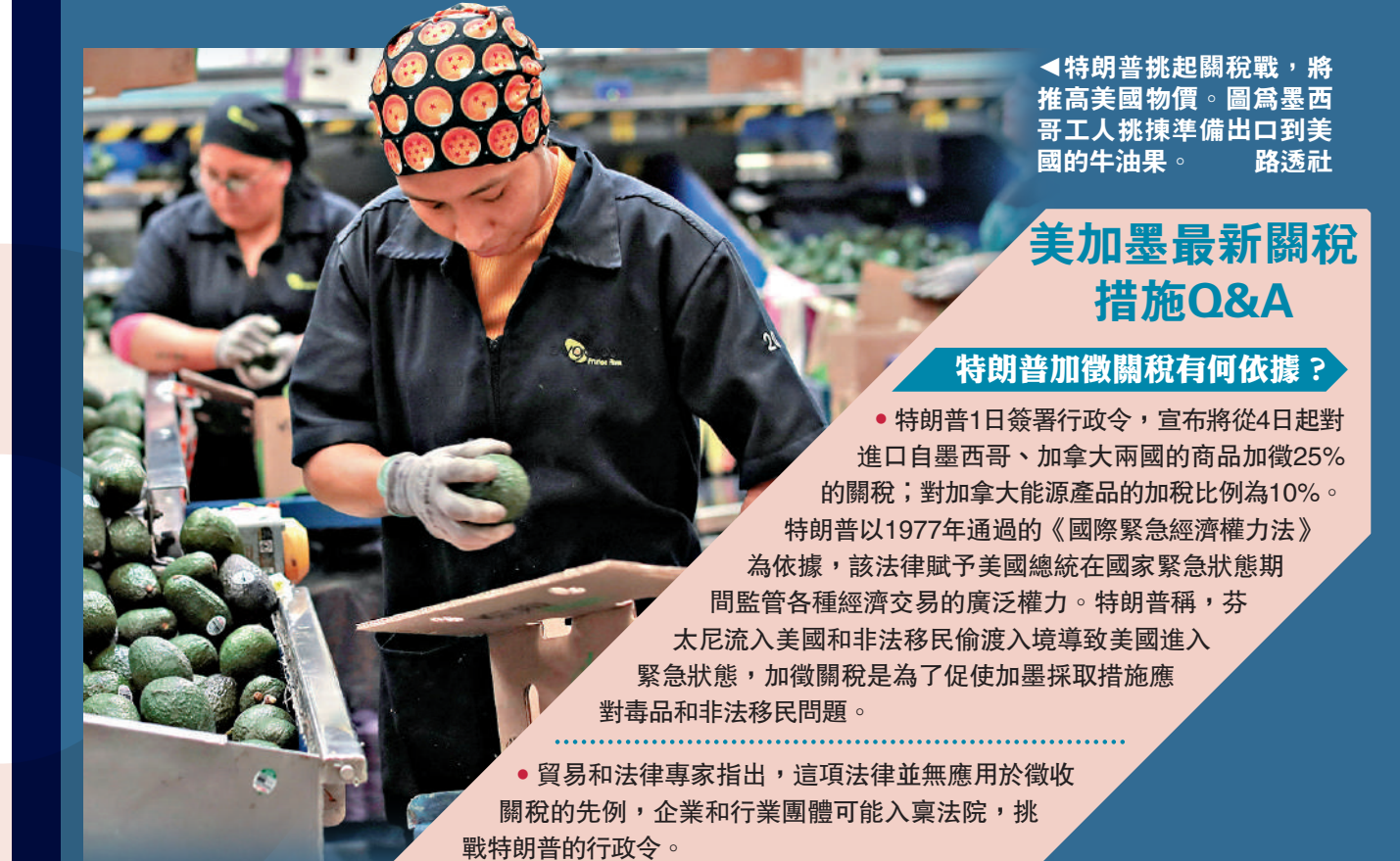
特朗普挑起關稅戰，將推高美國物價。圖為墨西哥工人挑揀準備出口到美國的牛油果。