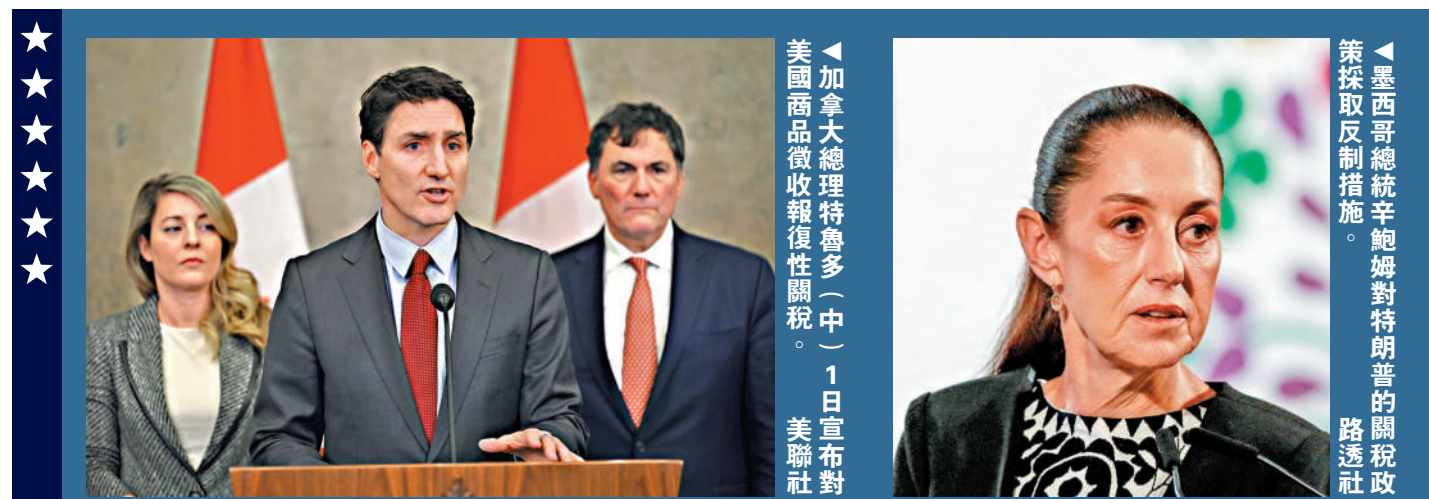
加拿大總理特魯多（中）1日宣布對美國商品徵收報復性關稅。