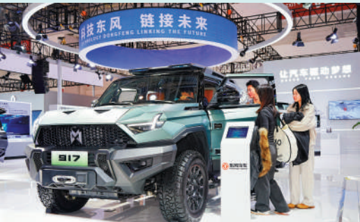
▲東風集團股價昨日曾大漲85%，市傳與長安汽車聯合重組。

其實，很多優質而業績預期還不差的股份，卻在這一升浪中坐了「冷板凳」，實在不大合理。「第二梯隊」尚未接力，炒來炒去都是那一堆，資金過度集中，終究會有一定風險者。