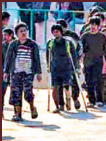
▲有「豬仔」被打斷腳，要用拐杖才能走路。