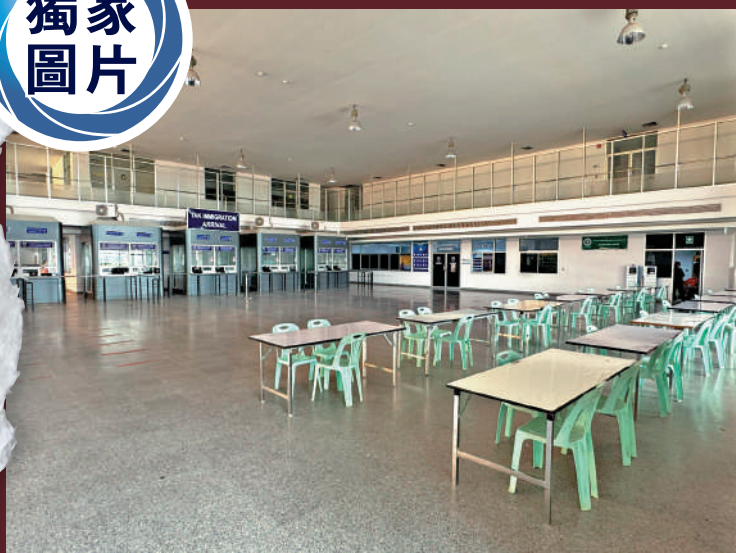
▲大公報記者昨天發現二號泰緬友誼大橋的檢查站內，擺放了多張枱檯，為今日遣送「豬仔」作準備。