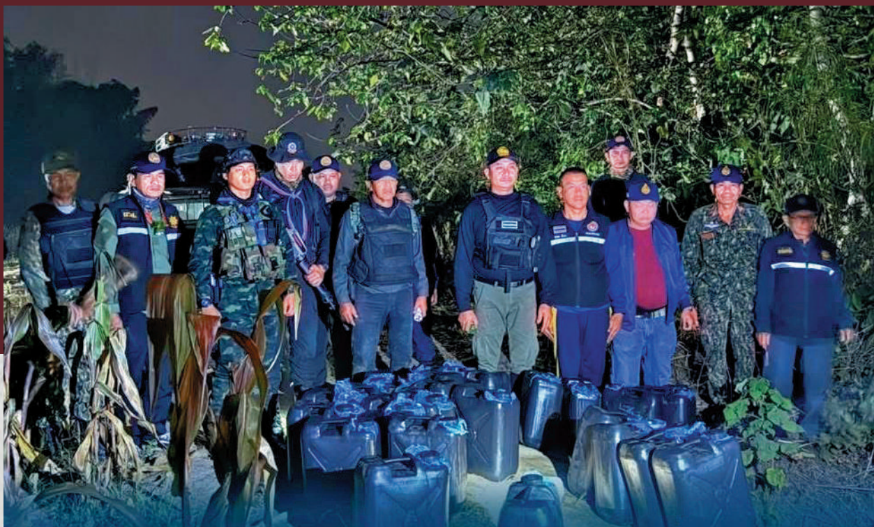
▲昨日凌晨，泰國軍警在邊境莫艾河邊拘捕3名走私燃油的男子，檢獲540公升柴油。