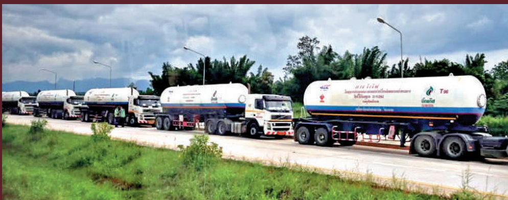
▲泰國禁向緬甸運輸燃油後，大批運油車未能通過邊境檢查站。