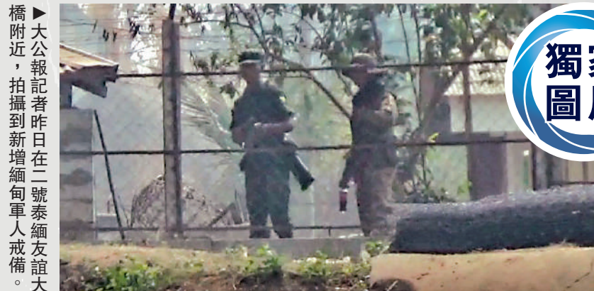
▲大公報記者昨日在二號泰緬友誼大橋附近，拍攝到新增緬甸軍人戒備。