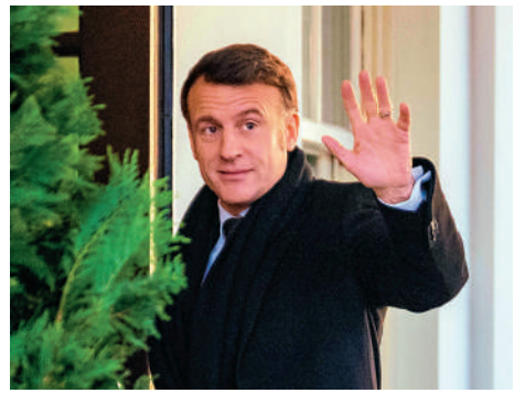
▲法國總統馬克龍24日到訪美國白宮。

另外，當地時間24日上午，俄羅斯駐法國馬賽領事館遭投擲燃燒瓶，目前暫無人員傷亡或損失報告。俄方認為此事「具有恐怖襲擊的特徵」，要求法方迅速全面進行調查。