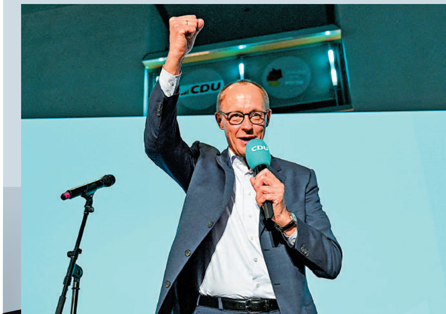
▲聯盟黨領袖默茨有望出任德國下一屆總理。