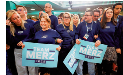
▲默茨的支持者23日在聯合黨總部等待投票結果公布。