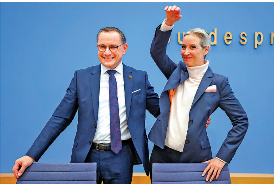
▲德國選擇黨聯合領導人魏德爾（右）和克魯帕拉24日出席德國大選後的新聞發布會。

分析人士普遍認為，如果聯盟黨和社民黨組閣成功，二戰後德國歷史上常見的兩黨「大聯盟」回歸，但也未必意味着新的政府就能提供德國