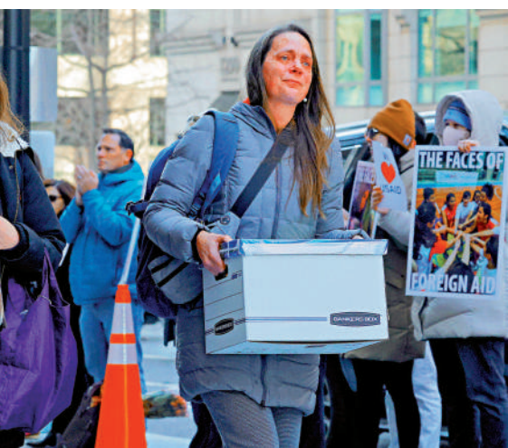
▲美國政府23日宣布，約1600名美國國際開發署美國本土員工將被解職。

道，特朗普政府目標是把美國國際開發署全球僱員規模由超過1萬人削減至不足300人，削減比例達97%。據報道，長期以來，USAID以對外援助為名，資助干涉他國內政等活動。該