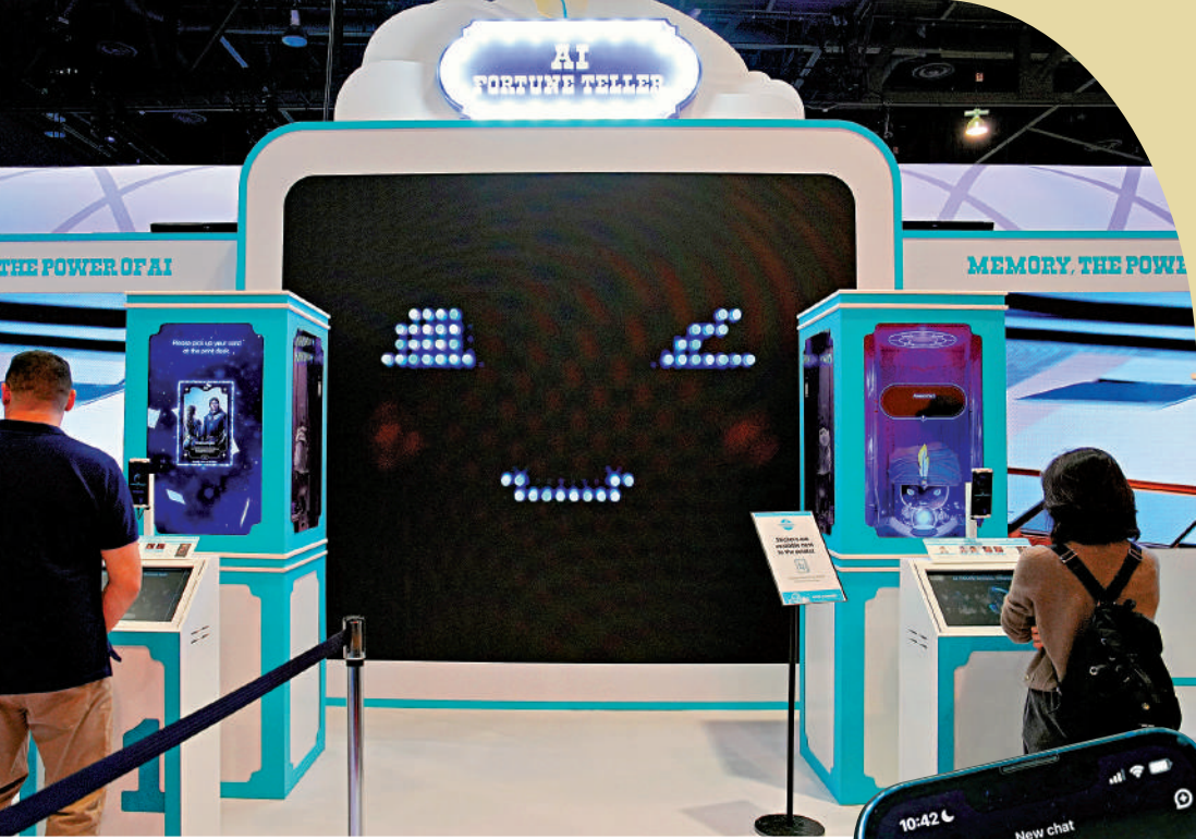
▲在拉斯維加斯舉行的2025國際消費電子展（CES）上，韓國SK集團展出AI算命模型。