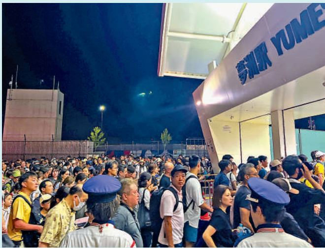
▲大阪世博會夢洲站地鐵口14日凌晨人滿為患。

這也是連接世博會的地鐵第二次出現故障。4月23日大阪地鐵中央線因故障，地鐵停運近1小時，導致世博會夢洲站約4000名遊客及工作人員受困。日本《朝日新聞》14日報道，1970年的大阪世博會也出現單日遊客過多、大量遊客被困情況，這次宛如「噩夢重演」。（綜合報道）