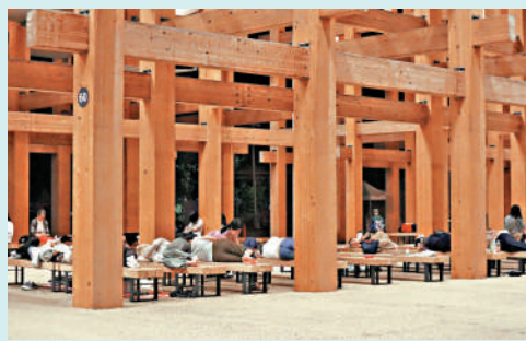
▲遊客在大阪世博會木質「大屋頂環」下的長椅過夜。

filitarasiuk： 這是在開玩笑吧？世博會官方根本沒有任何應急準備。要是地震了怎麼辦？官方簡直是讓民眾自生自滅。