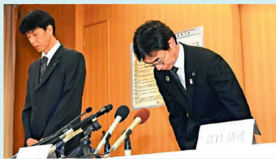
▲大阪府官員14日為地鐵故障道歉。