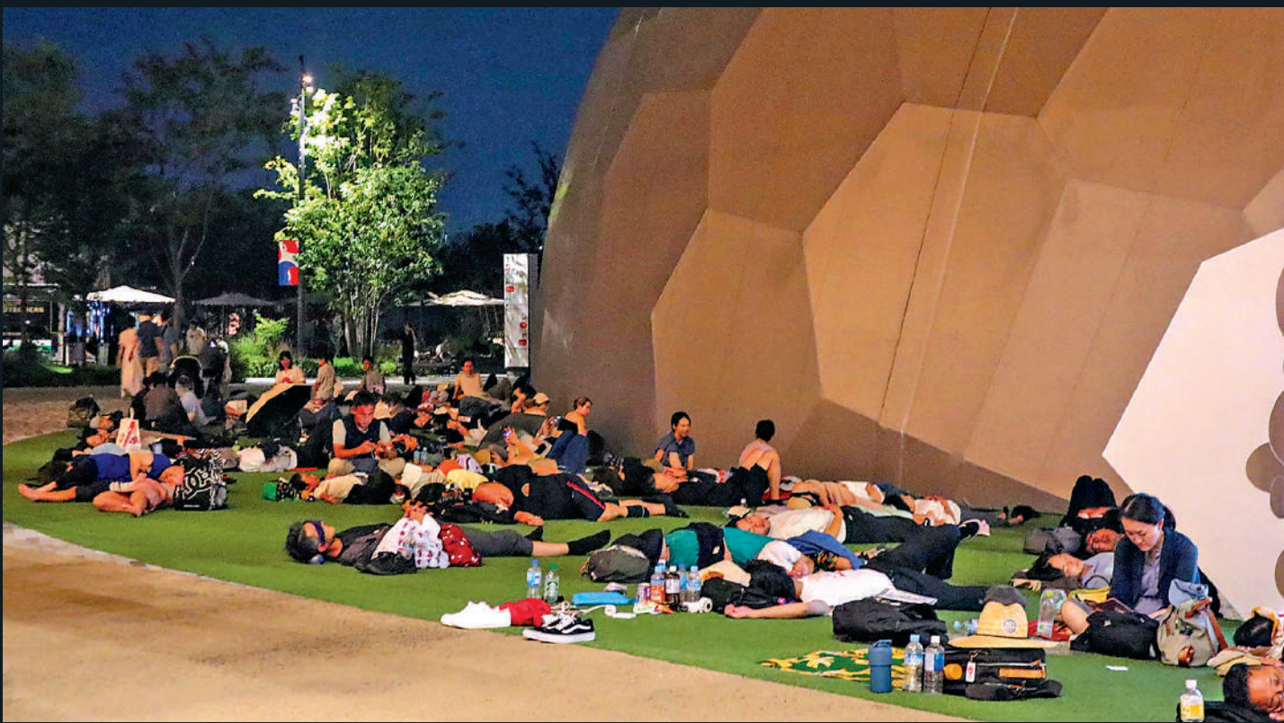
▲遊客14日凌晨在大阪世博會場內打地鋪過夜。