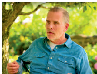
▲拜登次子亨特·拜登接受採訪視頻截圖。