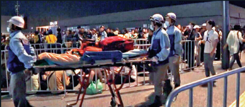
▲大阪世博會大量遊客被困，消防人員將感到不適的遊客送往醫院。

連接日本大阪世博會會場與市區的唯一地鐵線，在當地時間13日晚上因電力系統故障停運，導致超過三萬名遊客滯留。當局緊急調派接駁巴士，仍然有大批遊客被迫滯留會場過夜。地鐵直至14日清晨才恢復運營。日本近期遭遇高溫天氣，截至14日早上，至少36人身體不適送醫。有遊客表示，原本期待的世博會結果「變成了一場災難」。