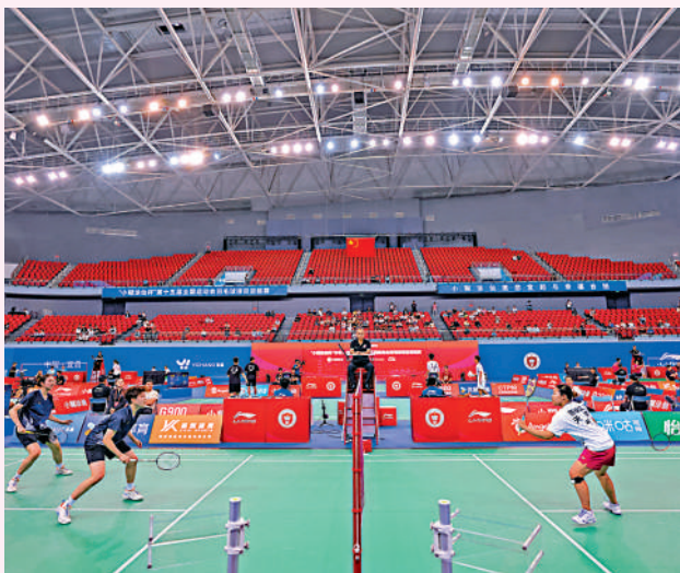
▲羽毛球項目資格賽13日在湖北宜昌揮拍開賽。

今屆全運會羽毛球項目資格賽有來自20餘個省（區、市）的700餘名頂尖選手參賽。根據賽程，比賽於8月13日至18日進行團體資格賽，19日至22日將進行5個單項資格賽。