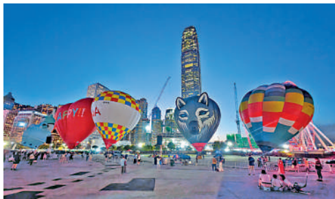
▲香港國際熱氣球節一直未能提供熱氣球載人體驗。

天文台今晨發出三號強風信號，香港國際熱氣球節主辦單位昨日在社交網站表示，如果活動開始前兩小時發出三號或八號信號，或者活動進行期間發出八號信號，活動將會取消；在「早上時段」，若活動進行期