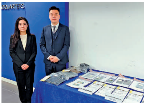
▲警方搗破假演唱會門票詐騙集團，拘捕12人。

處拘捕12名本地人，8男4女年齡介乎18至48歲，報稱無業、倉務員等，部分有黑社會背景，其中9人涉嫌串謀詐騙，3人涉嫌串謀洗黑錢。此次行動偵破了由今年6月1日至13