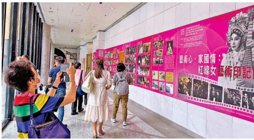
▲觀眾參觀「藝術心·家國情：紅線女藝術印記圖片展」。