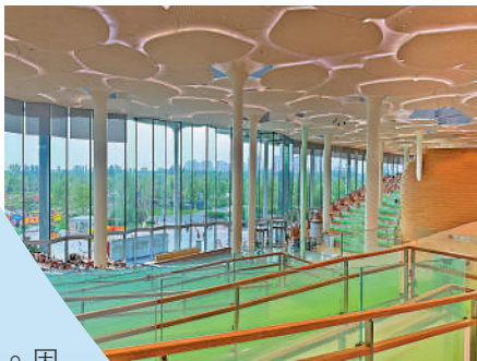
▲北京城市圖書館形似銀杏樹的天幕。

大運河是中國古代創造的一項偉大工程，是世界上距離最長、規模最大的運河，包括京杭大運河、隋唐大運河、浙東運河三部分，它橫跨北京、天津、河北、山東、江蘇、浙江、河南和安徽八個省市，全長近3200公里，擁有2500多年的歷史，是中國古代重要的漕運通道和經濟命脈，2014年成功列入《世界遺產名錄》。