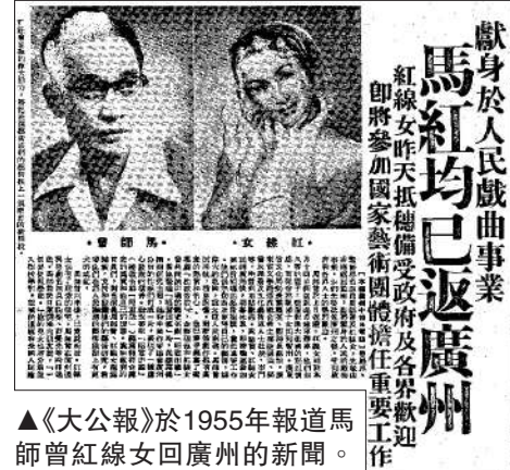
▲《大公報》於1955年報道馬師曾紅線女回廣州的新聞。

觀眾眼前。《大公報》於1983年報道了紅線女由穗抵港的消息，在《歡樂滿東華》節目中與新馬師曾合作進行義演籌款。