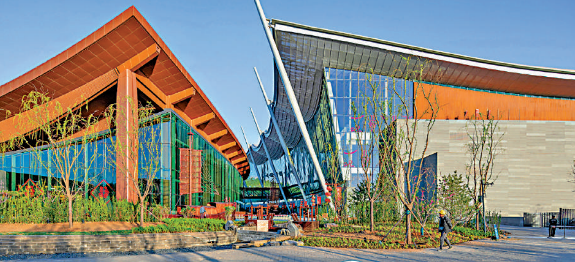
▲北京大運河博物館外形似「運河之舟」。