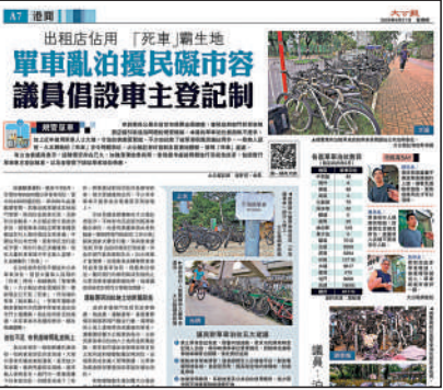
▲《大公報》上個月報道多區單車亂泊擾民問題，引起社會反響。

《大公報》上個月一連兩日就單車泊位、未來發展等問題作出專題式報道，就現時多區因單車泊位不足，導致單車亂泊的亂象、共享單車隨街亂泊等情況，作深入的前線採訪及作出改善建議，又訪問多名學者及議員、地區人士，探討單車泊位於新發展區增加興建的可行性以及規劃「單車城市」的倡議。