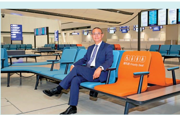
機場二號客運大樓將於下周二率先啟用旅遊車候車大堂。

【大公報訊】記者伍軒沛報道：為配合機場三跑道系統工程改建的二號客運大樓（T2），將於下周二（23日）起分階段啟用，其中旅遊車候車大堂將率先開放。大堂設有多間跨境交通營辦商的售票櫃檯、內地機場候車處和航空公司抵港貴賓室。機管局表示，二號客運大樓的離港層預計明年首季啟用，屆時會有航空公司的辦票櫃位，其後再按需求啟用抵港層。