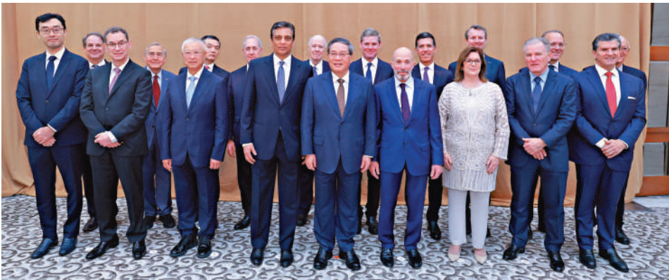
▲當地時間9月25日，國務院總理李強在紐約同美國友好團體座談。這是座談前，李強同與會嘉賓合影。

李強指出，中國有信心有能力保持經濟穩定健康發展，為包括美國企業在內的各國企業創造更多機遇。無論外部環境如何變化，中國都將竭盡所能為外資企業發展提供更多確定性。一是中國將始終秉持建設性和負責任態度，同美方在