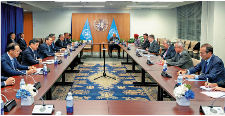
▲當地時間9月24日，國務院總理李強在紐約會見聯合國秘書長古特雷斯。

李強表示，希望歐方同中方一道拿出實際行動，增進互信、以誠相待、重信守諾，堅持求同存異，從大處着眼，尋求利益契合點，找到最大公約數，推動中歐合作不斷深化發展，更好造福雙方人民。希望歐方履行保持貿易和投資市場開放的承諾，堅持公平競爭和世貿組織規則，避免將經貿問題泛政治化、泛安全化。