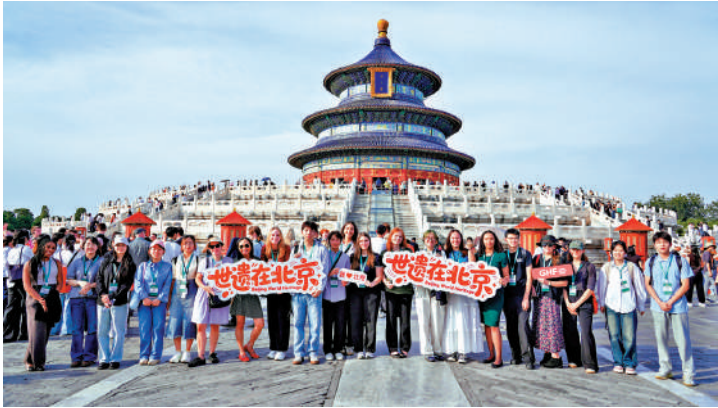
▲25日，國際青年北京世界遺產體驗之旅在天壇公園啟動。

【大公報訊】記者江鑫嫻北京報道：在北京中軸線申遺成功一周年和中國加入《世界遺產公約》40周年之際，北京市民間組織國際交流促進會、北京市文物局和黃廷方慈善基金，共同邀請百餘名海外大學生來到北京，與40名中國大學生一起，開啟「世界遺產在北京」國際對話暨國際青年北京世界遺產體驗之旅。