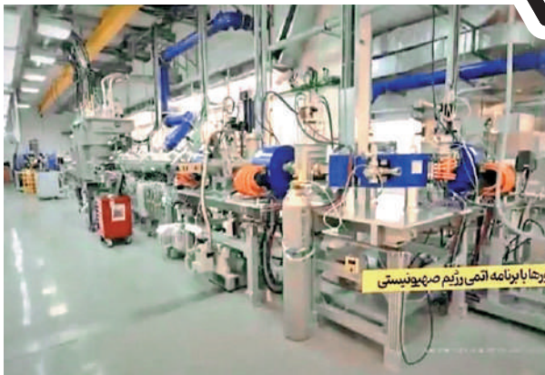
▲伊朗國家電視台24日公布以色列迪莫納核基地的內部照片。網絡圖片

核設施進行透明、公正的監督。 此外，以色列25日對也門首都薩那胡塞武裝據點進行空襲，當地傳出多次爆炸聲。以色列國防部長卡茨表示，這是報復胡塞武裝23日對以色列紅海度假勝地埃拉特一家酒店發動無人機襲擊，造成20人受傷。 （綜合報導）