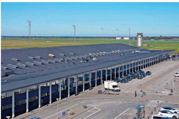
▲丹麥奧爾堡機場25日遭到無人機干擾。

關鍵基礎設施的「嚴重襲擊」。弗雷澤里克森25日已就最新的無人機干擾事件，與北約秘書長呂特進行溝通。俄羅斯駐丹麥大使館15日堅決否認俄方參與事件的指控。 丹麥政府25日表示，將增強偵測與攔截無人機的能力。丹麥司法大臣胡梅爾高表示，「此類混合攻擊的目的是散播恐懼、製造分裂並嚇阻我們。」丹麥國防大臣波爾森稱，歐盟將於當地時間26日召開會議，討論加強歐洲範圍內無人機防範措施的相關問題。