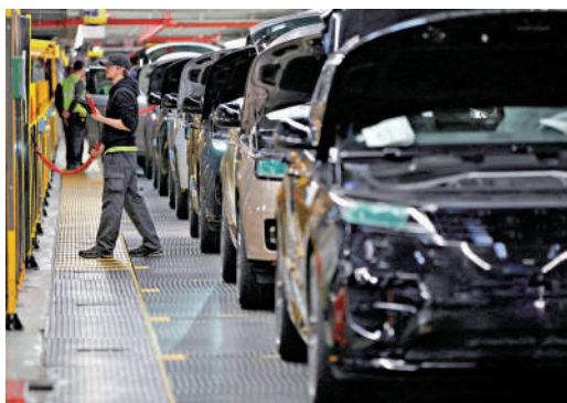
▲英國豪華車廠捷豹路虎位於索利赫爾的工廠生產線。路透社

【大公報訊】綜合路透社、BBC報道：英國最大汽車製造商捷豹路虎（也稱積架路華）24日宣布，因為黑客攻擊導致的停工期延至10月1日，生產暫停長達4周，總損失可能超過2億英鎊（約21億港元）。英媒報道，英國政府正考慮出手對捷豹路虎提供財務支援。 這家隸屬印度塔塔汽車集團的豪華車製造商，在英國設有三座工廠，每日總產能為1000輛汽車。捷豹路虎8月31日發現遭遇黑客網絡攻擊，被迫關閉IT系統，隨後宣布其在英國的三家工廠全面關停至9月9日。該車廠後來宣布停工延長至9月24日。停工將導致該車企每周至少虧損5000萬英鎊（約5.2億港元），其3.3萬名員工也被迫停工。捷豹路虎的供應鏈還包括眾多中小企業，支持逾10萬個工作崗位。英國聯合工會警告說，長期停工將需要政府提供支持。 據BBC報道，英國政府正考慮從供應商購買零部件，以支持相關企業運營至捷豹路虎復產。另一項選擇則是向供應商提供政府支持的貸款，但未獲供應商的普遍支持。