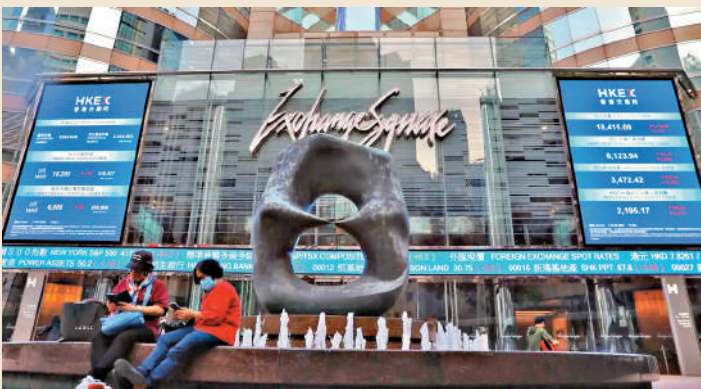
◀ 特區政府致力深化和擴大香港與內地金融市場的互聯互通。