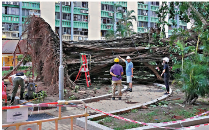
▲何文田愛民邨一棵高約30多米大樹，前日被強風連根拔起，工人昨日到場清理。

力；各區同步向市民發布最新颱風資訊、協調部門資源、支援弱勢居民防風安排，風眼掠過期間持續回應求助。