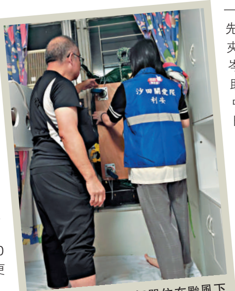
▲利安邨利盛樓一個單位在颶風下窗戶跌在街上，關愛隊到訪住戶，協助利用索帶緊固窗戶，以免發生危險。