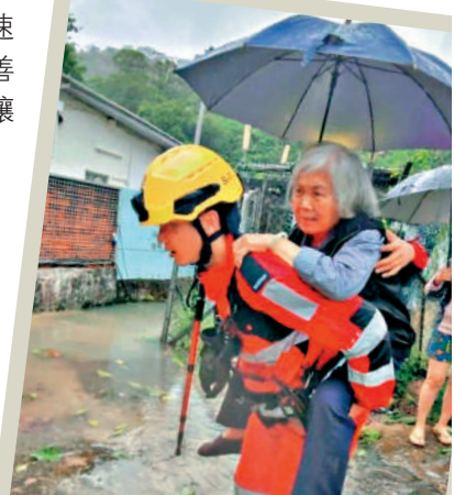
▲受颶風影響，香港多區沿岸水位上升，消防處派員協助受影響居民撤離暫避。