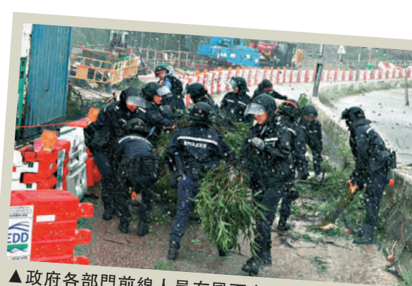
▲政府各部門前線人員在風雨中堅守崗位守護市民。

香港在超強颱風襲擊下得以安然度過，展現良政善治新氣象。事實證明，只要官民協作，上下一心，就沒有戰勝不了的風浪，香港的明天會越來越好！