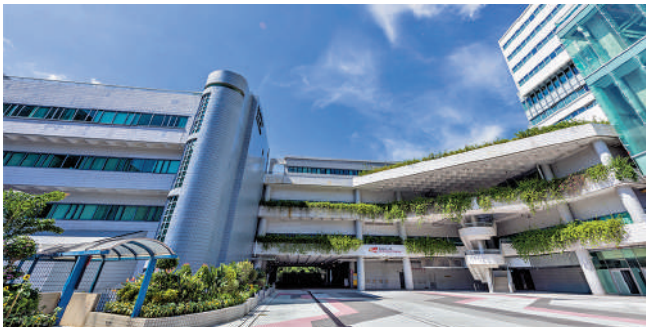
▲城大下學年起不再參與「統招」，將獨立招收內地高考生。

展至十個，並為入讀旗艦課程的本地優秀學生提供豐厚獎學金，包括全額或半額學費、宿舍費，以及一次性最高達50萬港元的海外交流資助。學生有機會到訪世界頂尖院校，包括麻省理工學院、倫敦帝國學院、牛津大學、哈佛大學、劍橋大學及康奈爾大學等作海外交流。