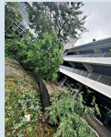
▲拔萃男書院校園內，多棵大樹被吹倒。

另外，灣仔香港華仁書院前日（24日）亦於校網及社交平台通知，多棵樹木倒塌阻塞車輛通道及學生步道，校方需時評估其他樹木狀況。學校昨日實施停課，部分科目改為網課，教師亦可能安排功課或與學生線上會議，校方表示，昨日原本為教師專業發展日，學生毋須回校，將安排童軍協助清理倒樹，盡快恢復校園秩序。