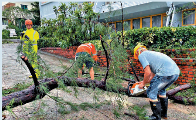
▲赤柱聖士提反書院工友清理倒塌樹木。

上榜的嶺大學者涉及的學術領域包括人工智能、數據科學、人文社科等前沿領域。當中，嶺大校長及韋基球數據科學講座教授秦泗釗教授在其學術領域，即工業工程與自動化的學術生涯組別再度位列全國及香港特區第一位。秦校長向一眾嶺大傑出學者致以祝賀，並期待更多嶺大學者將研究成果轉化為知識與技術，造福社會，回應數字時代所需。