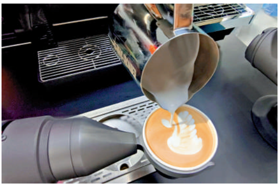
▲機器人製作的咖啡拉花則精緻美觀，泡沫綿密，味道醇香。

位於北京亦莊經濟技術開發區的全球首家具身智能機器人4S店今年8月開業，作為開放平台，這家4S店與隔壁的中國首家AI機器人主題餐廳「機器人焰究所」形成聯動，讓前沿機器人技術走出實驗室、融入日常生活，為人們帶來集科技體驗、美食享受與消費互動於一體的全新體驗。從主題餐廳電梯上二樓，可以直接進入4S店，很多顧客都會在就餐之後到4S店逛逛。這裏有機器人製作的拉花咖啡、烤串、冰淇淋等小食飲品，小朋友們可以與機器人「擎天柱」「大黃蜂」零距離接觸，還可以觀看加速進化的足球機器人現場展示高球球技。