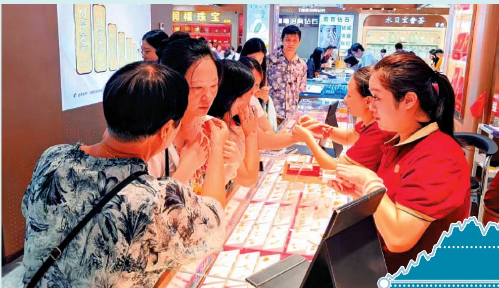
▲國慶和中秋雙節期間，黃金需求不斷上揚。圖為來自安徽的母女在深圳水貝黃金交易中心挑選項鏈。

對於未來黃金市場的走勢，不少商家和消費者都持樂觀態度。他們認為，隨着全球經濟形勢和地緣政治因素的變化，黃金作為避險資產的功能將更加凸顯。「現在黃金的保值功能很強，不少投資者都看好黃金市場。」一位商家表示，國慶期間的人流量和銷售量，都證明了黃金市場的熱度不減。