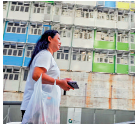
▲何小姐表示，今次事件政府迅速作出回應，值得讚賞。

大公報記者昨日下午抵達屯門欣寶路簡約公屋地盤，現場所見地盤吊機正在運作，門口有工人值班，並有混凝土車進出。住在附近的居民何小姐表示，