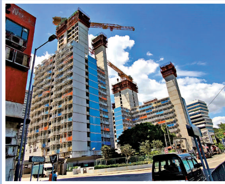
柴灣常安街簡約公屋項目