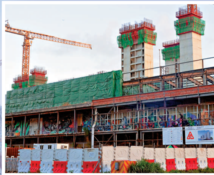
小欖樂安排簡約公屋項目